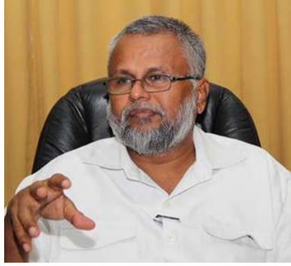
பாடுகள் ஏற்படுத்திய விளைவுகளில் ஒன்றாக புத்திஜீவிகளுக்கும் தற்போது நம் மத்தியில் வெற்றிடம் ஏற்பட்டுள்ளது..

ஒரு காலத்தில் புத்திஜீவிகளினால் நிரம்பியவர்களாக நம்மவர்கள் இருந்தனர். கடந்த காலத்தில் தமிழர்களின் தலைமைகள் என்று கூறிக்கொண்டவர்களின் விவேகமற்ற வீரத்தின் வெளிப்