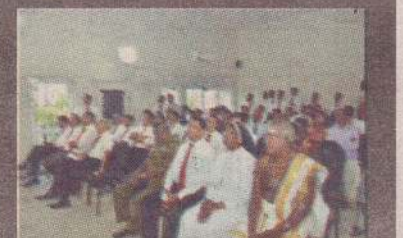
Audience at the opening ceremony in the multi-function room, which can accommodate more than 60 people.