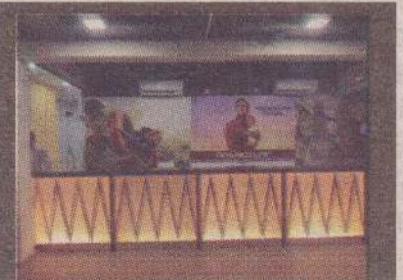
Customer Service area