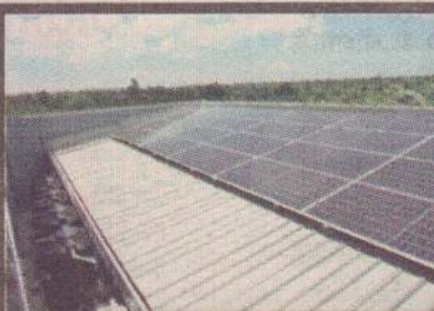
Solar panels fixed and the rain water harvesting facility