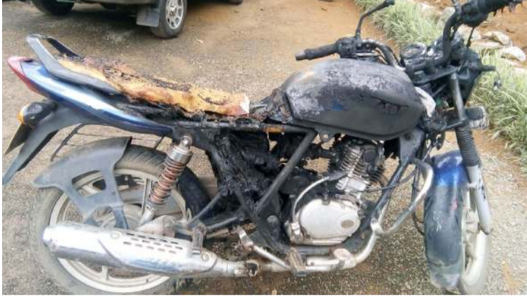
பொலிஸாரால் அறுவர் கைது செய்யப்பட்டுள்ளனர். கைதானவர்கள் றுவரெலியா நீதிமன்றத்தில்

கொழும்பு, செப் 13 லிந்துலை பொலிஸ் பிரிவுக்குட்பட்ட பம்பரகலை ஓடிண்டன் தோட்டத்தில் நேற்று முன்தினம் இரவு இரு குடும்பங்களுக்கிடையில் ஏற்பட்ட மோதலில் இருவர் காயமடைந்துள்ளனர். அத்துடன், மோட்டார் சைக்கிளொன்றும் தீயிட்டுக் கொளுத்தப்பட்டுள்ளது. மோதல் சம்பவம் தொடர்பில் லிந்துலை