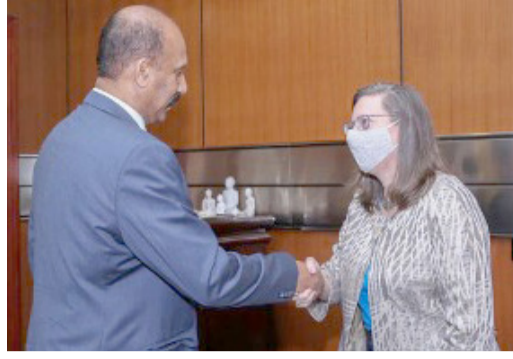
கொழும்பு, செப் 13

ளரினால் அறிவிக்கப்பட்டது. தற்போது கட்டடத்தின் நிலம்புனரமைப்பு செய்யப்பட்டு அதன் தன்மை தொடர்பில் ஆணையாளருக்கு மீள அறிவிக்கப்பட்டுள்ளது. எனவே, கடந்த காலத்தில் வாரத்தில் திங்கள், வியாழன் ஆகிய இரு தினங்கள் வழங்கிய மருத்துவ சேவையை மீள வழங்கி உதவுமாறு கோரப்பட்டுள்ளது. கடந்த மூன்று வருட காலத் தில் மட்டும் 3420இற்கும் மேற் பட்டோர் இங்கு சிறந்த மருத்துவ சேவையைப் பெற்று நன்மையடைந்துள்ளனர் என புள்ளி விவரம் மூலம் தெரியவந்துள்ளது.