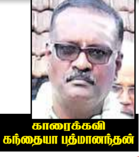
காரைக்கலி கந்தையா பதிமாணந்தன்

உ ப்பிட அப்பவும் ஆச்சியும் பணயின்றை பெருமை பற்றி வாக்குவாதப்பட்டுக்கொண்டு நிக்க பொட்டுக்கால வந்த மலர் அஞ்சாறு பனங்காயை அவையின்றை ஆச்சி குடுத்துவிட்டவ எண்டு எங்கட ஆச்சியிட்டை குடுத்துப்போட்டு பனங்கொட்டை சூப்பிக்கொண்டிருந்த என்னை கடைக்கண்ணால் ஒரு பார்வை பாத்துக்கொண்டு போனான். என்னை மனச அப்பிடையே ஆடி பனை மாதிரி ஆடத்தொடங்கிட்டு. சித்திரையில துடங்கிற நொங்கு சீசன் அப்பிடையே ஆடியிலை தொடங்கி ஐப்பி வரை பனங்காய் சீசனா போய் முடியும். பனங்காய் சீசனிலை ஆச்சி, விடியக் காலத்தாலையே எழும்பு மோனை. உங்க ஆக்கள் போய் பொறுக்கிறாக்கிடையில போய் பக்கத்தில தம்பையா பாட்டுக்குள்ளை போய் பனங்காய் பொறுக்கிக் கொண்டு வா வெண்டு எழும்புவா. மோனை மோனை எண்டு கூப்பிட்டும் எழும்பாட்டில் சனியனே என்ன கொப்பனை மாதிரியே மூசி மூசிக் கொண்டு கிடக்கிறாய் எண்டு பச்சைத் தண்ணியை ஊத்துவா. உடன நான் விழுந்தடிச்ச கொண்டு எழும்புவன். எழும்பி முகம் கழுவாமலேயே குண்டியால விழுகிற காச்சுட்டையை இழுத்து முடிஞ்சுகொண்டே விழுகிற பனங்காய் பொறுக்க உரப்பையோடையும் குஞ்சுக் கடத்தோடையும் நான் போக அங்க பக்கத்து வீடுகளிலையுள்ள பெடி பெட்டையள் எல்லாம் பனங்காய் பொறுக்க எண்டு வந்து நிக்கங்கள். பிறகென்ன விடிய விடிய போட்டி போட்டு ஓடி ஓடி பனங்காய் பொறுக்குவம். நாம்கள் முந்தி எங்கட ஊரில இருக்கிற பனந்தோட்டங்களை பாடு எண்டுதான்