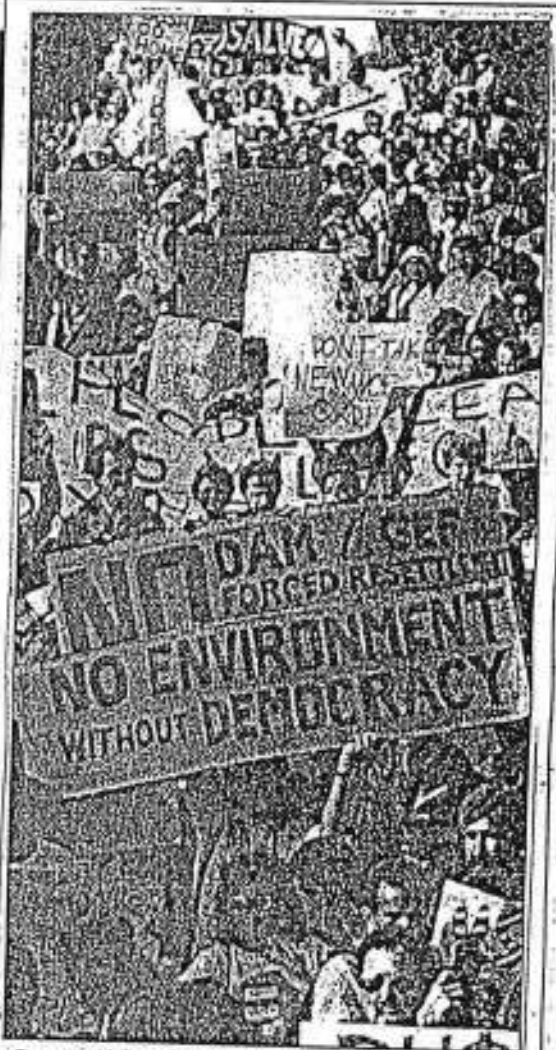
பித்திரவணை நுகர்வோர் பெரிதானதைத் தவிர்ப்பு களையும், அப்பெரிதானதைகளையும் பாதித்து. இது தவிரை குற்றம் என்று செறித்தே தான் நாடு பெற்றது. இன்று வரையும் அது பாணியில் கிடு நிறுவனம் கள் வெவ்வேறு மருந்துகள் செய்துவருகின்றது. மனிதனை மருந்துபெரிதான குற்றம் செய்து வந்து உள் சிந்திரவணை குற்றம் என உலகநாடுகளில் அங்குரியபெரி- ந்து. (மேற்கு ஸ்ரீலங்கா உலகநாடுகளில், மேற்கத்திய உலகம்தீயியவர்கள் மருந்துவந்த துறைமுகம் செய்துவரும் போதுகொண்ட சிந்திரவணை அ.மருந்து நாடு மருந்துகளை நலம் பெரிதானதைகள் "என்ற நூலில் விவரமாக குறிப்பிட்டுள்ள எதையுள்ளாய்")

நாடுகளின் சிந்திரவணை நுகர்வோர்களில் இருந்து பெரிதானதைத் தவிர்ப்பு- களையும், அப்பெரிதானதைகளையும் பாதித்து. இது தவிரை குற்றம் என்று செறித்தே தான் நாடு பெற்றது. இன்று வரையும் அது பாணியில் கிடு நிறுவனம் கள் வெவ்வேறு மருந்துகள் செய்துவருகின்றது. மனிதனை மருந்துபெரிதான குற்றம் செய்து வந்து உள் சிந்திரவணை குற்றம் என உலகநாடுகளில் அங்குரியபெரி- ந்து. (மேற்கு ஸ்ரீலங்கா உலகநாடுகளில், மேற்கத்திய உலகம்தீயியவர்கள் மருந்துவந்த துறைமுகம் செய்துவரும் போதுகொண்ட சிந்திரவணை அ.மருந்து நாடு மருந்துகளை நலம் பெரிதானதைகள் "என்ற நூலில் விவரமாக குறிப்பிட்டுள்ள எதையுள்ளாய்")