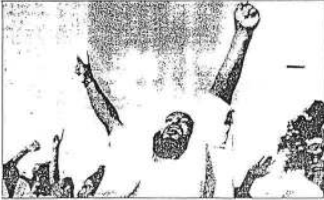
'தாஸ்லிமாவுக்கு மரணதண்டனை வழங்கு! பங்களாதேஷ் மதவெறியர்கள் ஆர்ப்பாட்டம்

அவர்கள் மத்தியிலிருந்து தஸ்லிமா போன்ற கலகக் குரல்கள் உருவாகி விடக்கூடாதென்றுதான் வெறியர்கள் காட்டுக்கூச்சல் போடுகிறார்கள். கலகக்குரல்கள் இல்லாமல் ஜனநாயகம் பிறக்காது; மத வெறியர்களுக்கு வரலாற்றுப் பாடங்கள்