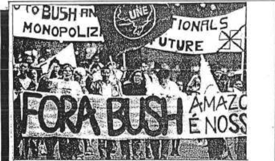
புதிர்வாழ்வு, அமெரிக்க எதிர்ப்பு, அமெரிக்க எதிர்ப்பு உள்நாட்டில்.

சுற்றுச்சூழல் பாதுகாப்பு, மாநாட்டில், அமெரிக்கா என்கிற சாத்திட மறுத்ததால், அந்திரோ மெரிக்கா மீதும் பெருந்தொகைத் திரண்டு, அமெரிக்காவின், புதிற் சாதாரணம் அங்கு வளர் நடத்தித் தங்கள் எதிர்ப்பைத் தெரிவித்தனர். அமெரிக்காவின் அபாயம்தான் தான் மேற்கூறிய ஜனநாயக வாதிகள் 'அல்லமாத் தான் கண்டித்தார்கள்'.