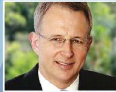
Minister for Families and Social Services Paul Fletcher