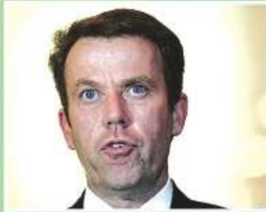
Minister for Education Dan Tehan