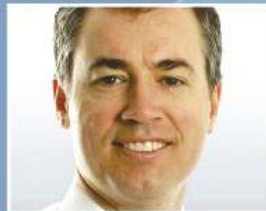
Minister for Human services and digital transformation Michael Keenan