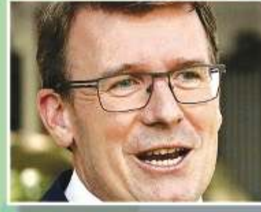
Minister for Cities, Urban Infrastructure and Population Alan Tudge