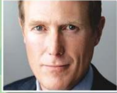
Attorney-General Christian Porter