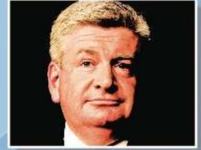
Minister for Communications and the Arts Mitch Fifield