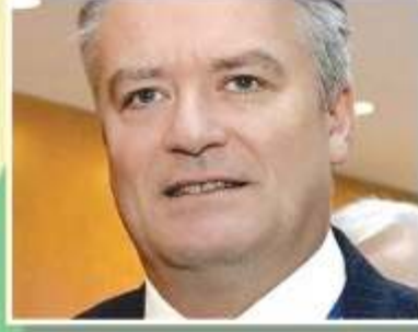
Minister for Finance and the Public Service Mathias Cormann