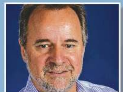
Minister for Indigenous Affairs Nigel Scullion