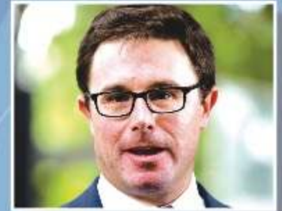
Minister for Agriculture and Water Resources David Littleproud