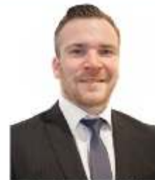
Leigh Hall Director