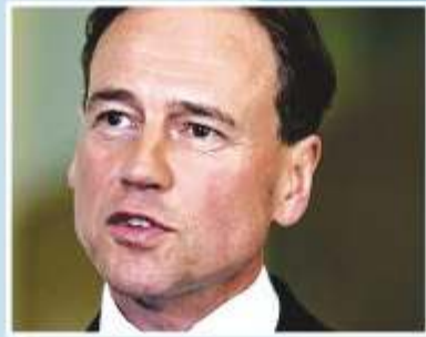
Minister for Health Greg Hunt