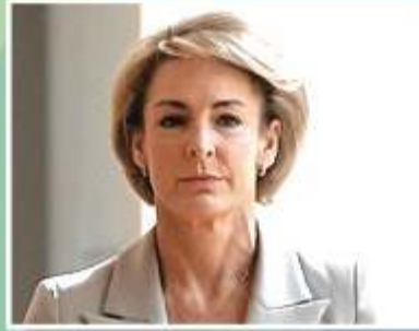
Minister for Small and Family Business, Skills and Vocational Education Michaelia Cash