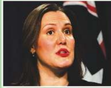
Minister for Jobs, Industrial Rela- tions and Women Kelly O'Dwyer