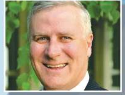
Deputy Prime Minister and Minister for Infra- structure, Transport and Regional Development Michael McCormack