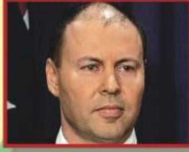
Treasurer Josh Frydenberg