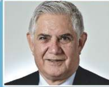
Minister for Senior Australians and aged care Ken Wyatt