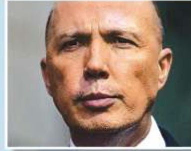
Minister for Home Affairs Peter Dutton