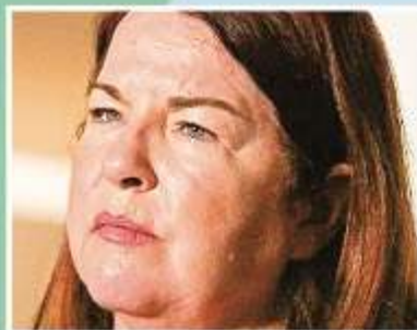
Minister for the Environment Melissa Price