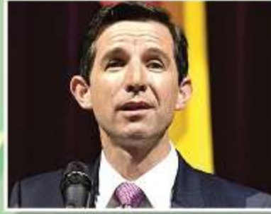
Minister for Trade, Tourism and Investment Simon Birmingham