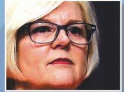
Minister for Industry, Science and Technology Karen Andrews