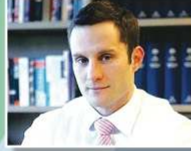
Minister for States Alex Hawke