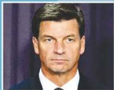
Minister for Energy Angus Taylor