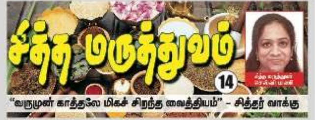
“வருமுன் காத்தலே மிகச் சிறந்த வைத்தியம்” - சித்தர் வாக்கு

மேல்வயிற்றில் வலி மற்றும் அந்த வலியானது முதுகு இடுப்பு வரை பரவுதல், செரிமானக் கோளாறுகள், நெஞ்சு எரிச்சல் வயிறு உப்பிசும் போன்ற குறிஞ்சுணங்கள் இருப்பதால் பித்தப்பை கற்களாக இருக்க வாய்ப்புகள் உண்டு. ஆனால் மூலம் Ultva sound பரிசோதனை முறையின் மூலமாக கற்களின் அளவு மற்றும் அது தங்கியுள்ள இடம் அனைத்துதையும் தெளிவாக கண்டறிய முடியும்.