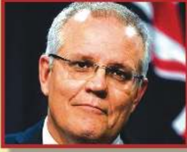
Prime Minister Scott Morrison