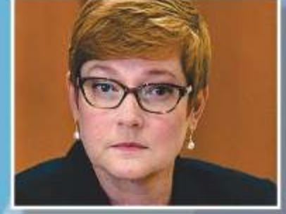
Minister for Foreign Affairs Marise Payne