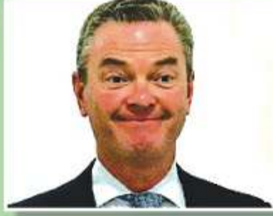
Minister for Defence Christopher Pyne