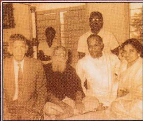
பெரியார் ஈ.வே.ரா.வுடன் அமிர்தலிங்கம் (1972)