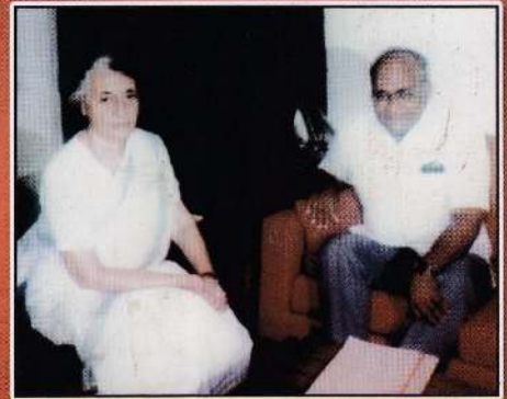
இந்திரா காந்தி அவர்களுடன் அமிர்தலிங்கம் (1983)