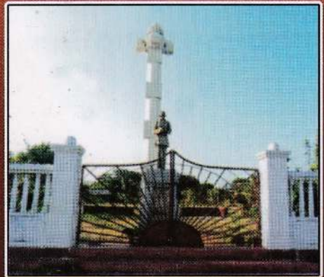
தந்தை செல்வா நினைவுத் தூபி