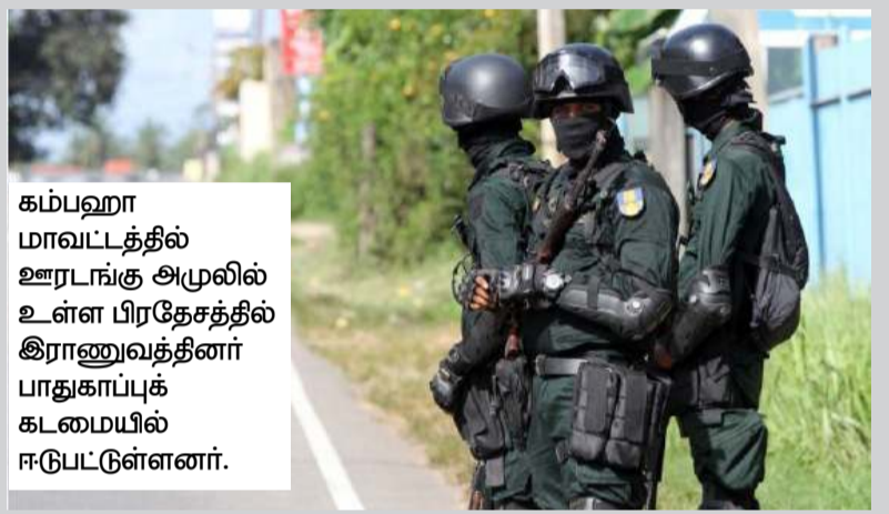
கம்பஹா மாவட்டத்தில் ஊரடங்கு அமுலில் உள்ள பிரதேசத்தில் இராணுவத்தினர் பாதுகாப்புக் கடமையில் ஈடுபட்டுள்ளனர்.

சுய தனிமைப்படுத்தலில் இருந்த வேளை காய்ச்சலினால் பாதிக்கப்பட்ட குறித்த இளைஞர் இம்மாதம் 2ஆம் திகதி சிலாபத்திலுள்ள கொரோனா பரிசோதனை நிலையத்தில் சேர்க்கப்பட்டார். இதன்போது அவருக்கு மீண்டும் கொரோனா வைரஸ் பாதிப்புள்ளமை தெரியவந்துள்ளது - என்றார்.