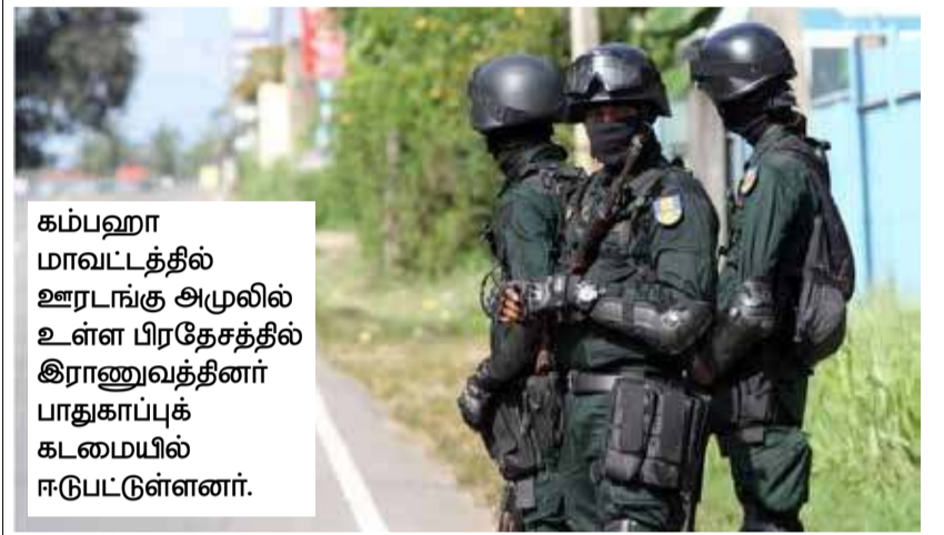
கம்பஹா மாவட்டத்தில் ஊரடங்கு அமுலில் உள்ள பிரதேசத்தில் இராணுவத்தினர் பாதுகாப்புக் கடமையில் ஈடுபட்டுள்ளனர்.