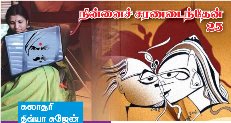
கலாநீர் த்வயா சஜேன்