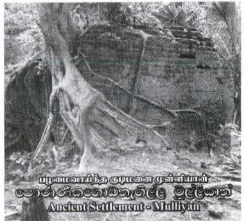
புழைவாய்ந்த குழை முள்ளியாள் ஆரினெயைவெட்டு இடலையின் Ancient Settlement - Mulliyar