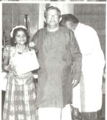
திருமுறை விழா 2017 இல் எடுக்கப்பட்ட படங்கள்