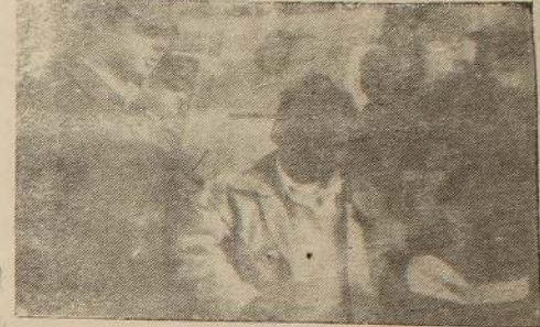
டென்மார்க்கிற்கு அப்பால் உள்ள கடலில் உயிர்காப்பு படகுகளில் தந்தளித்துக் கொண்டிருந்த இலங்கைத் தமிழ் அகதிகளில் ஒருவர் டென்மார்க் பொலிசாரால் விசாரணைக்காக அழைத்துச் செல்லப்படுவதை பேலுள்ள படத்தில் காணலாம்.