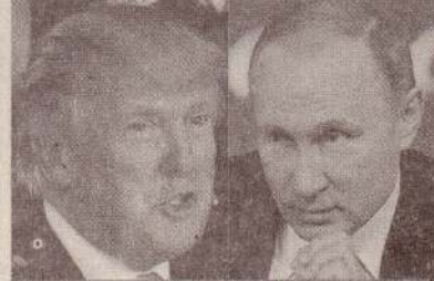
அமெரிக்கா மீது ரஷ்யா சாடல்

2015 ஆம் ஆண்டில், அப்போதைய அமெரிக்க ஜனாதிபதி பராக் ஒபாமா ஆட்சிக் காலத்தில் ஈரானுக்கும் அமெ