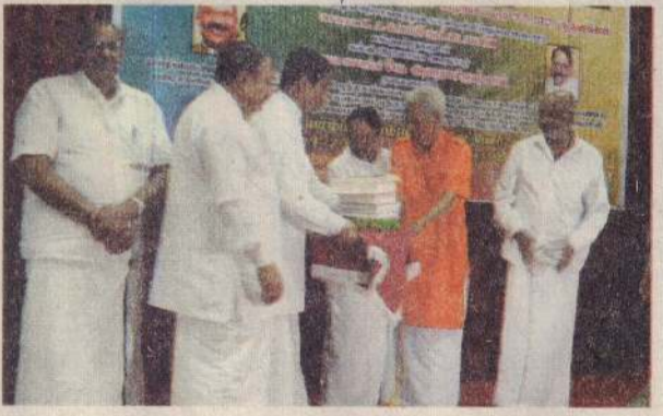
யாழ்ப்பாணம், செப். 19 யாழ். நூலகத்துக்கு 50 ஆயிரம் புத்தகங்களை தமிழ்நாடு அரசு வழங்கியது. பக்கம் 13

யாழ். நூலகத்துக்கு 50,000 நூல்கள் தமிழக அரசு நேற்று வழங்கியது