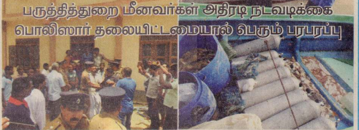
பருத்தித்துறை மீனவர்கள் அதிரடி நடவடிக்கை பொலிஸார் தலையிட்டமையால் பெரும் பரபரப்பு

ஆனாலும் தமது பகுதிகளில் இவ்வாறான தொழில் நடவடிக்கைகள் தொடர்ந்து மேற்கொள்ளப்படுவதால் தாம் தொடர்ச்சியாகப் பாதிக்கப்பட்டு வருகின்றனர் எனச் சுட்டிக்காட்டிய அந்தப் பகுதி மீனவர்கள், தமக்கான தீர்வு இனிமேலாவது கிடைக்க வேண்டுமென்று வலியுறுத்தினர். இந்தப் பிரச்சினைகளைத் தீர்ப்பதற்குக் கடற்பொலிஸ், நீரியல் வளத் திணைக்களத்தின் பணிப்பாளர் வருகை தர வேண்டு