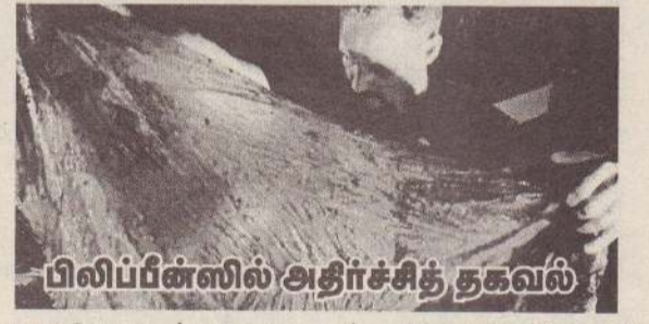
பிலிப்பீன்ஸில் அதிர்ச்சித் தகவல்

திமிங்கலத்தின் வயிற்றுக்குள் அரிசி பைகள் உள்பட சுமார் 40 கிலோ பிளாஸ்டிக் கழிவுகள் தேங்கியிருந்தமையக் கண்டு ஆராய்ச்சியாளர்கள் அதிர்ந்து போயினர். பிளாஸ்டிக் கழிவுகள் வயிற்றில் தேங்கியமையால் முறை