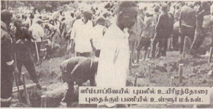
ஸிம்பாப்வேயில் புயலில் உயிரிழந்தோரை புதைக்கும் பணியில் உள்ளூர் மக்கள்.

வெள்ளம் பாதித்த பகுதிகளில் உள்நாட்டு போர்டீர்ப்பு சேவைகள் வேகமாகச் செயல்படாத நிலை ஏற்பட்டுள்ளதால் இங்கு 15 லட்சத்துக்கும் மேற்பட்ட மக்கள் கடும் சிக்கல்களை சந்தித்து வருகின்றனர் எனக் கூறப்படுகிறது.