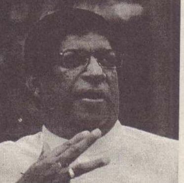
கொழும்பு, மார்ச் 21 நெடுந்தீவில் காற்றாலை மின்

அமைச்சர் ரவி அறிவிப்பு உற்பத்தி நிலையம் அமைக்கப்பட்டு அந்தப் பிரதேச மக்களின் மின் தேவை நிறைவு செய்யப்படும் என்று மின்வலு மற்றும் சக்தி வளத்துறை அமைச்சர் ரவி கருணாநாயக்க தெரிவித்தார். நெடுந்தீவுக்கு அண்மையில் மேற்பார்வைப் பயணம் மேற்கொண்டு அங்குள்ள நிலைமைகளை ஆராய்ந்த பின்னர் இந்த முடிவை அவர் அறிவித்துள்ளார். நெடுந்தீவில் சுமார் 4 ஆயிரத்து