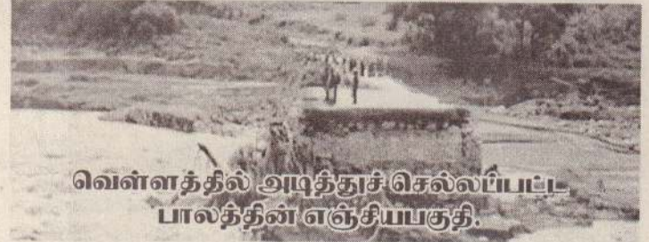
வெள்ளத்தில் அடித்துச் செல்லப்பட்ட பாலத்தின் எஞ்சியபகுதி.

இடாய் புயலின் பயங்கரத் தாக்குதலால் கிழக்கு ஸிம்பாப்வேயில் பெரும் சேதாரங்களும் இழப்புகளும் ஏற்பட்டுள்ளன. குறிப்பாக சிமானிமாணி நகரத்தில் இதன் தாக்கம் கடுமையாக ஏற்பட்டுள்ளது" - இவ்வாறு