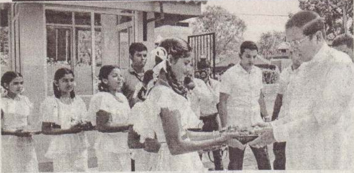
கொழும்பு, மார்ச் 22

புலிகள் அமைப்பின் தலைவர் பிரபாகரன் வடக்கில் வனவளத்தை பாதுகாத்தார். அவர் செய்த ஒரேயொரு நல்ல விடயமாக இதை கருதலாம் என்று ஜனாதிபதி மைத்திரிபால சிறிசேன தெரிவித்தார். சர்வதேச வன பாதுகாப்பு தினத்தை முன்னிட்டு நேற்று முற்பகல் திம்புலாகலை வெவ்ஹரகல மகா வித்தியாலயத்தில் நடைபெற்ற நிகழ்வில் கலந்துகொண்டு உரையாற்றுகையிலேயே ஜனாதிபதி மேற்கண்டவாறு கூறினார்.