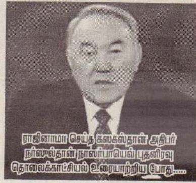
ராஜினாமா செய்த கஸகஸ்தான் அதிபர் நர்ஸுல்தான் நாஸர்பாயெவ் புதனிரவு தொலைக்காட்சியில் உரையாற்றியபோது.....

டாகாயெவ் பதவியேற்ற சில நிமிடங்களிலேயே, தனது பதவியின் முதல் கடமையாக முன்னாள் அதிபரின் பெயரை கஸாக்குகளின் நகரமான அஸ்தானாவுக்கு சூட்டப்பட உள்ளதாகத் தெரிவித்தார்.