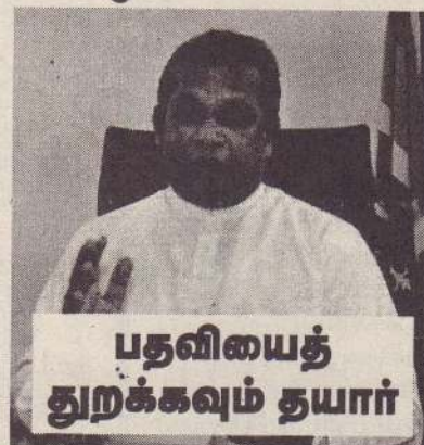
பதவியைத் துறக்கவும் தயார்

தாம் வைத்திருக்கிறார் எனத் தெரிவித்துள்ள அவர், இதனைச் சும்மா இருக்கலாமென்ப பிரதமரிடம் கூறி