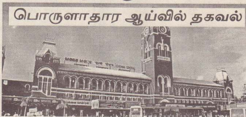
பொருளாதார ஆய்வில் தகவல்