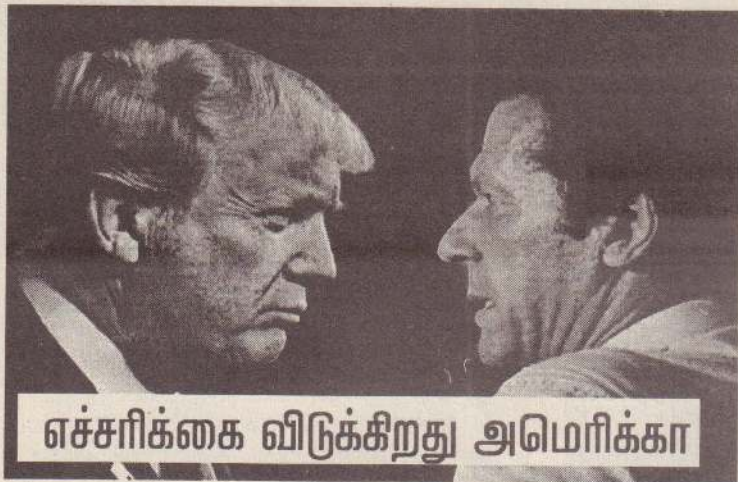
எச்சரிக்கை விடுக்கிறது அமெரிக்கா

தற்போதைய சூழலில் இந்தியா மீது பாகிஸ்தான் தாக்குதல் நடத்தினால் நிலைமை மிகவும் மோசமாகிவிடும் என அமெரிக்கா பாகிஸ்தானுக்கு எச்சரிக்கை விடுத்துள்ளது.