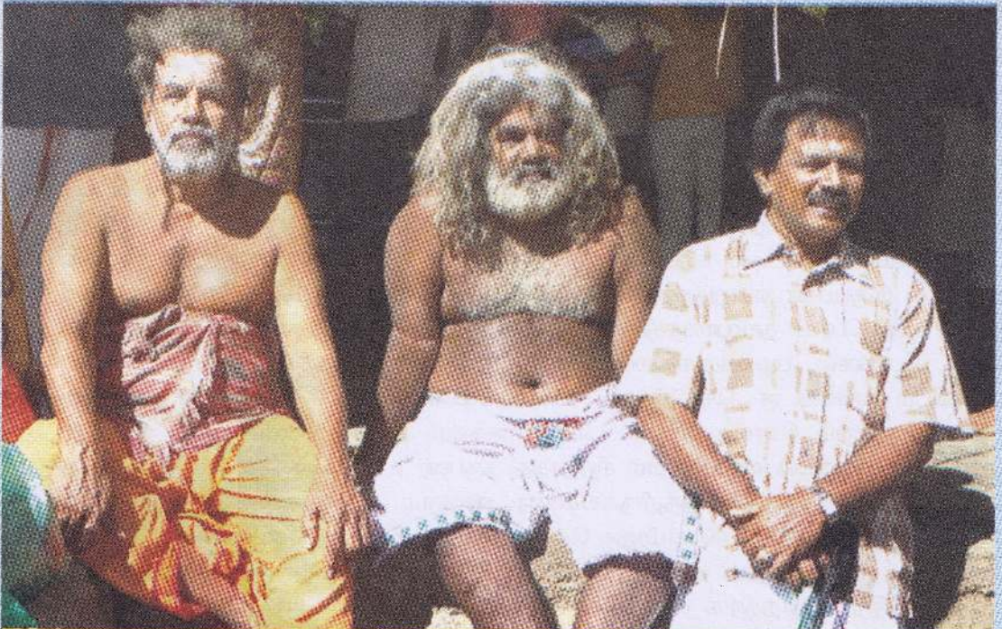
அஞ்சாமையைவிட நேர்மையாக இருத்தலே அழகானது.

நம் இடங்களில் நடைபெறும் ஆலய பூசை வழிபாடுகளின்போது பஞ்சபூராணம் ஒதுவதற்குப் பதில் தேவாரமும், பூராணமும் பாடி அந்நிகழ்வை முடித்துக்கொள்கின்றோம். தேவார முதலிகளால் கொண்டுவரப்பட்ட பஞ்சபூராண நிகழ்வானது குறுகி வரும் காலத்தில் ஆலயங்களில் அந்நிகழ்வு இடம்பெறாமல் போய்விடுமோ என்ற ஆதங்கம்தான் எனக்கு இவ்விடயத்தை சீர்தூக்கிப் பார்க்க வைத்தது. அங்கே இறை சிந்தனையை வளரக்கிறார்கள். முற்றுமுழுதாக தமிழர் வாழும் பிரதேசங்களில் எமக்குரிய வழிபாட்டுச் செயல்களைக் குறைத்துக்கொண்டு போவது எமது சமூகத்துக்கு நல்லதல்ல. வழிபாட்டுக்குக்கூட நேரத்தை ஒதுக்கமுடியாத நிலை எமக்கு. இவ்விடயத்தில் பெரும்பான்மை மக்கள் வாழும் பிரதேசத்தில் அவர்களோடு எம்மையும் ஈடுபடவைத்த வழிபாடானது போற்றுதற்குரியது. வழிபாடு