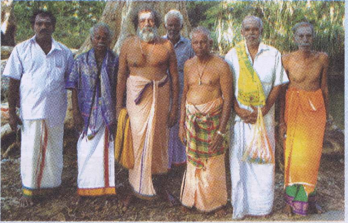
கூறிவிட்டு ஆண்கள் அனைவரும் ஆலயத்தை நாடிச் சென்றார்கள். நாமும் அவசர அவசரமாக செல்லப் பிள்ளையார் ஆலயத்தைச் சென்றடைந்தோம்.