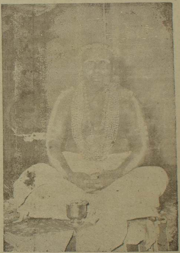
நல்லையில் நிலைத்த ஒளி

— குளி தளைய்தாரியார் — யிருக்கிறது. உதிப்போற்றுக்கு எட்டுக்கல்வி ஆராய்ச்சி தேவை யில்லை. உறுதிக்க இன்றியமை யாதது ஒன்று உண்டு. அதனே இம், மலைக் கைத்து சாயினும், அன்பு- முருகன் உண்மை சண்டு வாவிடந்து வீழினும். முருகன் இயற்கைகாழ்வு செயலுத்தி நம்மைக்காப்பான் எல்லாம் நோன்புகாத்த அழியாப் பேறு உறுதி முருகவழிபாட்டிற்கு பெற்ற சித்தர்கள் வாழ்ந்த இன்றியமையாததாகும் இவ்வுறுதியுடையார் விருப்பம் நூடு நம் நாடு. முருக வழி எல்லா நன்மைகளும் பெறுவர். பாட்டிற்கு இல்லறமே சிறந்த முருகப் பெருமான், தன்னை தாரும். இல்லறம் என்பது வழிபடுவோருக்குத் தோன்றாத இயற்கை அறம். இல்லறம் தனையாயிருந்தால் செய்வதும் இளமை, அழகு முதலியவற்றைக் காத்து மக்கட் பேறு தெரியும், மன உறுதியால் நல்கி கடவுட்சன்மை எய்துவ எல்லா நன்மைகளும் முருக தற்கு இயல்பாய் இயற்கை னிடம் பெறலாம். உறுதியாய் அமைந்துள்ள நல்லற யென்பது அரிதாயும் எளிதான மாறும்.