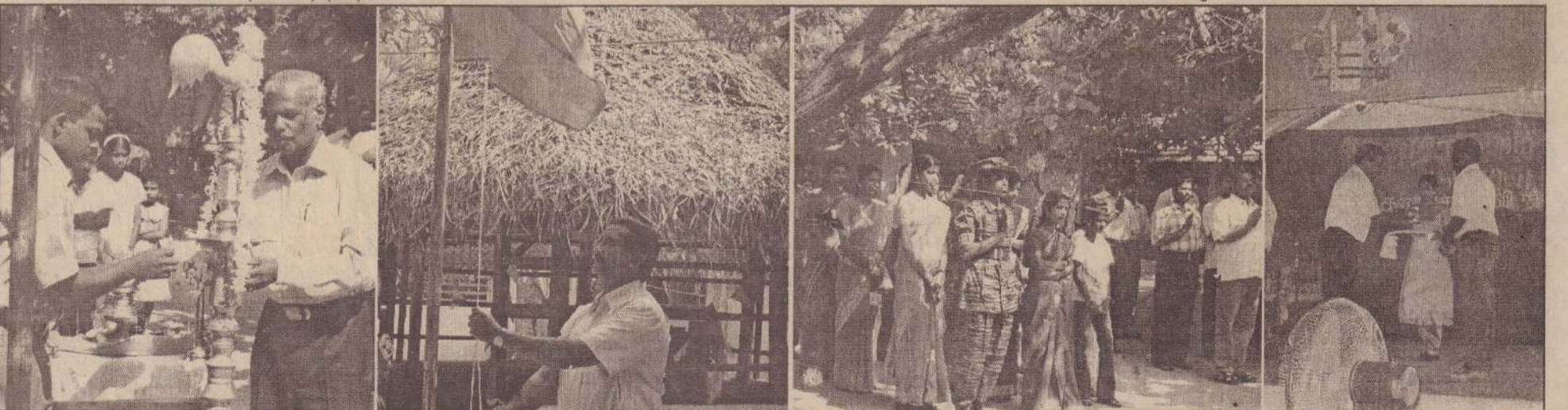
புதுக்குடியிருப்பு மாணவர் அமைப்பால் நடத்தப்பட்ட கணனிப் பயிற்சி நிலையத்தில் பயிற்சி நெறியை முடித்த மாணவர்களுக்கான பரிசில் வழங்கும் வைப்பம் அண்மையில் இடம்பெற்றது. நிகழ்வில் முல்லைத்தீவு வலயக் கல்விப் பணிப்பாளர் ப.அரியரத்தினம் பொதுச்சுடர் ஏற்றுவதையும் தமிழீழ அரசியல்துறைத் துணைப்பொறுப்பாளர் சோ.தங்கன் தமிழீழ தேசியக்கொடி ஏற்றுவதையும் தேசியக் கொடிக்கு மரியாதை செலுத்தப்படுவதையும் மாணவி ஒருவருக்குப் பரிசில் வழங்கப்பட்டு

விளையாட்டு முற்றத்தை அமைத்த ஆசிரியர்களும் மாணவர்களும் பரிசில் வழங்கிக் கௌரவிக்கப்பட்டனர். (8-352) (24)