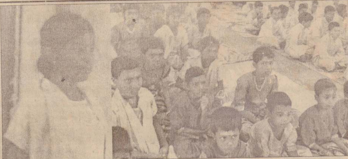
யாழ்ப்பாணம், நீராவியடி சைவபரிபாலன சபை மண்டபத்தில் 'தாயகம்' சிறுவர் இல்ல சிறார்களினால் நேற்று நடத்தப்பட்ட திருநாவுக்கரசுநாயனார் குருபூசை நிகழ்ச்சியில் மாணவி ஒருத்தி உரையாற்றுவதையும் நிகழ்வில் கலந்து கொண்ட மாணவ, மாணவிகள் மற்றும் ஏனையோர்களையும் படங்களில் காணலாம்.