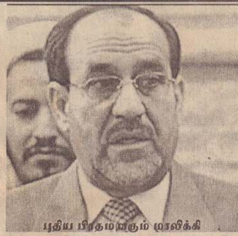
புஷ் ஈராக்கியின் ஜனநாயகத்தை நோக்கிய பாதையில் இது ஒரு மைல்கல் என்றார்.

பக்தாத், ஏப். 24 ஈராக்கில் மாதக்கணக்கில் இழுப்பட்டு வந்த அரசியல் முட்டுக்கட்டை நிலைமை புதிய பிரதமர் நியமனத்தின்மூலம் ஒருவாறு சீரடைவதற்கான அறிகுறிகள் தோன்றியுள்ளன. ஷியா இன அரசியல்வாதி ஜாவாத் அல்-மாலிக்கி ஈராக்கிய அதிபர் ஜலால் தலபானியால் புதிய அரசாங்கம் அமைக்கும்படி கேட்கப்பட்டுள்ளார். ஏற்கனவே பதவியிலிருந்த பிரதமர் இப்நாஹிம் அல் ஜாபரி பதவியிலிருந்து ஒதுங்கிக் கொண்டதையடுத்து மாலிக்கி நியமிக்கப்பட்டுள்ளார். ஈராக்கில் ஏற்பட்டுள்ள இந்த புதிய சூழ்நிலையை அமெரிக்க அதிபர் வரவேற்றுள்ளார். "பற்றுறுதிகொண்ட ஈராக்கிய மக்களின் இந்த வரலாற்றுச் சாதனை அமெரிக்காவின் பாதுகாப்பை மேலும் வலுவாக்கியுள்ளது" என்று அதிபர் புஷ் கூறியுள்ளார். ஈராக்கிய மக்களுக்குப் பாராட்டுத் தெரிவித்த அதிபர்