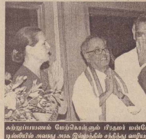
கற்றுப்பயணம் மேற்கொள்ளும் பிரதமர் மன்மோகன் சிங்கை டில்லியில் அவரது அரசு இல்லத்தில் சந்தித்து வரவேற்பும்போது...

இந்தியாவின் முக்கிய வர்த்தக கூட்டாளிகளில் ஜேர்மனியும் ஒன்று. ஜேர்மனியில் நடைபெறும் கண்காட்சியில் இந்தியா பங்கேற்கிறது. பொதுத்துறை நிறுவனங்கள் உட்பட பல்வேறு இந்திய நிறுவனங்கள் இந்தக் கண்காட்சியில் பங்கேற்கின்றன. ஜேர்மனியைப் போலவே மத்திய ஆசியப் பகுதியில் முக்கிய நாடாக விளங்குவது உஸ்பெகிஸ்தான். அந்த நாட்டுக்குச் செல்வதன் மூலம் அரசியல், பொருளாதாரம், இராணுவம் உள்ளிட்ட துறைகளில் தொடர்பு வலுப்படும் என்றார் பிரதமர். (ஐ)