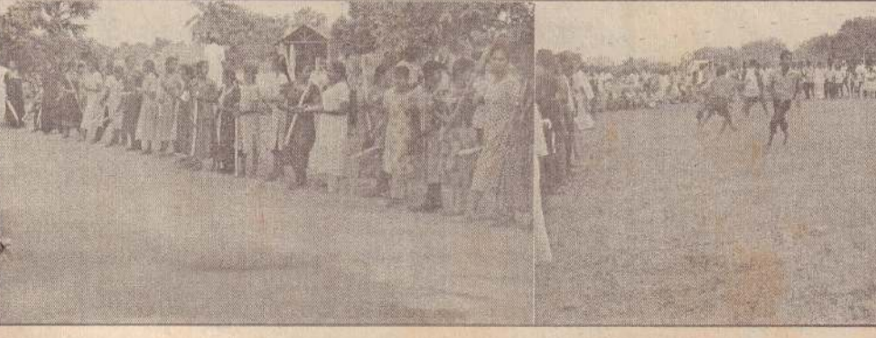
மக்கள் படைக் கட்டுமானப் பயிற்சி நிறைவேயொட்டி வட்டக்கச்சியில் நடைபெற்ற விளையாட்டுப் போட்டி நிகழ்வுகளில் எடுக்கப்பட்ட படங்கள் இவை. மரதன் ஒட்டப் போட்டிக்குத் தயாராகக் கொண்டிருக்கும் அணியினரையும் கிளிநொச்சி போட்டியில் ஈடுபடுவோரையும் படங்களில் காணலாம்.