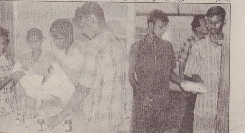
தீபம் அமைப்பினர் 'போரூட்' கிறுவன அலுவலகமூலம் ஊர்காவற்றுறை மாவட்ட வைத்தியசாலையில் சிரமதானம் மேற்கொள்வதைப் பட்டத்தில் காணலாம்.

சுகாதாரத் தொண்டர்களாகப் பணியாற்றியோருக்கு இது வரை காலமும் உலக உணவு நிறுவனத்தினால் மாதாந்த உலர் உணவுப் பொருள்கள் நிவாரணமாக வழங்கப்பட்டு வந்தன. தற்போது சுகாதாரத் திணைக்களத்தினால் சுகாதாரத் தொழிலாளர்களும் குடும்ப சுகாதார உத்தியோகத்தர்களும் போதுமான அளவு நியமிக்கப்பட்டதைத் தொடர்ந்தே சுகாதாரத் தொண்டர்களின் சேவை நிறுத்தப்படுவதாக கூறப்படுகிறது. (173)