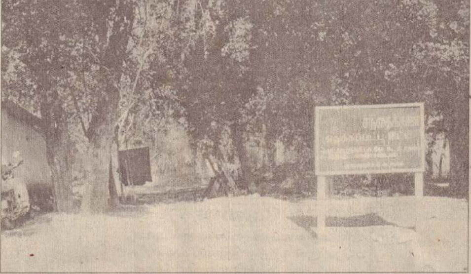
முழங்காவில் பிரதேசத்தில் சந்தை இல்லை என்று பல்வேறு தரப்பினரும் சுட்டிக்காட்டியதையடுத்து அங்கு சந்தை அமைப்பதற்கென இடம் ஒதுக்கப்பட்டது. நீண்டகாலமாக இடம் ஒதுக்கப்பட்ட நிலையில் இன்னமும் வேலைகள் தொடங்கவில்லை. அறிவிப்புப் பலகை மட்டுமே அங்கு காணப்படுவதைப் படத்தில் காணலாம்.