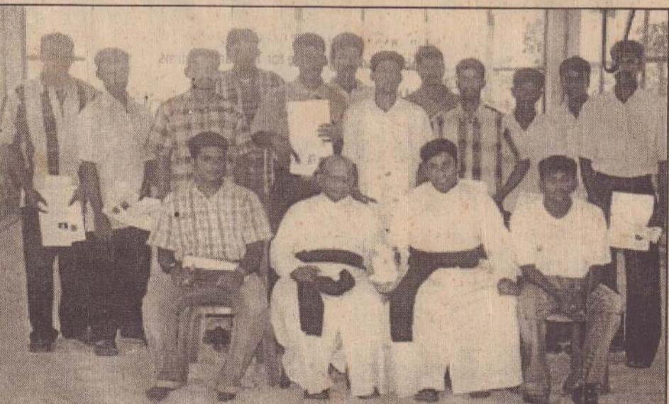
மணற்காட்டில் ஆழிப்பேரலையால் பாதிப்புற்ற சாரதிகளுக்கான சாரதிப் பத்திரம் அண்மையில் வழங்கப்பட்டபோது எடுக்கப்பட்ட படம்.

இந்தச் சைக்கிளைத் திருடிச் சென்ற நபர் பண்டத்தரிப்பு - சண்டிலிப்பாய் வீதியிலுள்ள கள்ளுத்தவறணை ஒன்றின் முன்பாக நிறுத்திவிட்டு தவறணைக்குள் சென்றார்