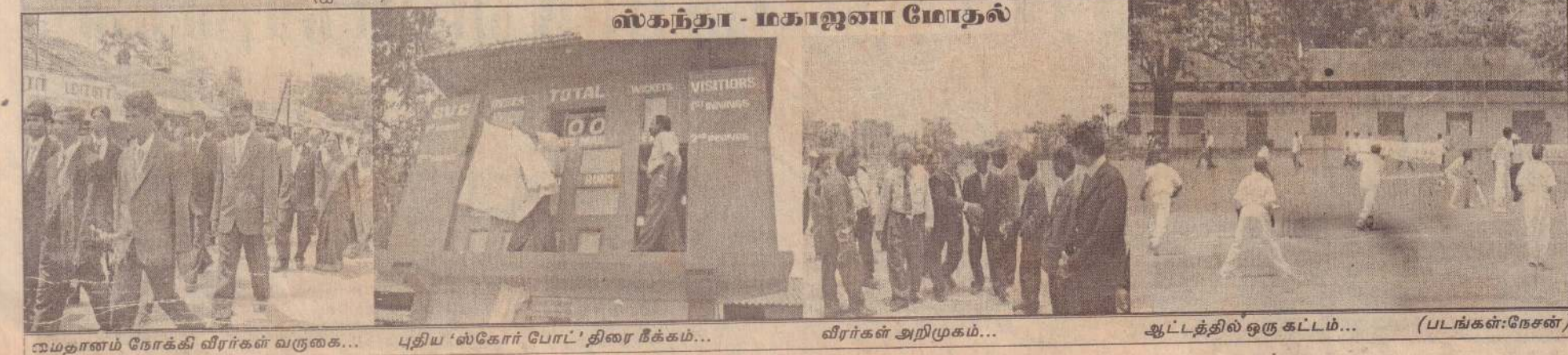
மணற்காடு நோக்கி வீரர்கள் வருகை... புதிய ‘ஸ்கோர் போட்’ திரை நீக்கம்... வீரர்கள் அறிமுகம்... ஆட்டத்தில் ஒரு கட்டம்... (படங்கள்: நேசன்)

நல்லூர் பொதுச் சந்தைப் பகுதியில் உள்ள தொலைபேசி விற்பனை நிலையம் ஒன்றை உடைத்து நுழைந்த திருடர்கள் அங்கிருந்த பொருள்கள் பலவற்றை அபகரித்திருக்கின்றனர். ஆடியபாதம் வீதியில் அமைந்துள்ள இந்த வர்த்தக நிலையத்தில் இருந்து சுமார் 60 ஆயிரம் ரூபா மதிப்புள்ள தொலைபேசிகள், பற்றறிகள் என்பன திருடப்பட்டிருக்கின்றன என்று முறையிடப்பட்டிருக்கிறது. கடந்த செவ்வாய்க்கிழமை இரவு இந்த திருட்டு இடம்பெற்றுள்ளது. இதேவேளை -அன்று இரவு சட்டநாதர் சிவன் ஆலயத்தின் உண்டியலும் உடைக்கப்பட்டு காணிக்கைப் பணம் திருடப்பட்டிருப்பதாகத் தெரிவிக்கப்படுகிறது. நல்லூர் மற்றும் கல்வியங்காட்டு பகுதிகளில் அண்மைக் காலத்தில் தொடர்ச்சியாக திருட்டுகள் இடம்பெற்றுவருவது குறிப்பிடத்தக்கது. (ஐ-180)