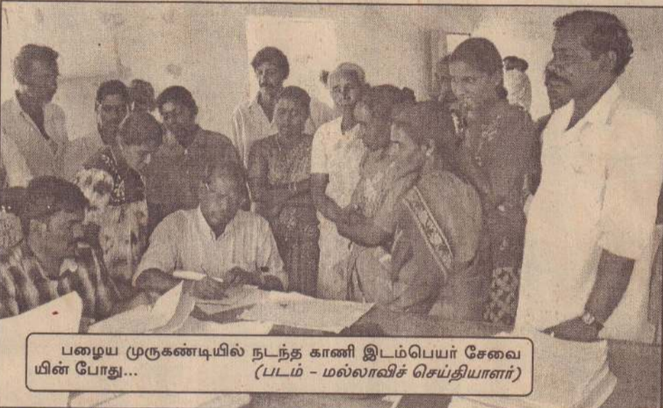
பழைய முருகண்டியில் நடந்த காணி இடம்பெயர் சேவையின் போது...

போசாக்கான உணவுகளிற்குத் தட்டுப்பாடு நிலவியது. இதனால் எமது மாவட்டத்தில் அதிகளவான போசாக்குக் குறைபாடு ஏற்பட்டுள்ளது - என்றார். (த-352-202)