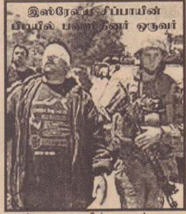
மருத்துவமனையில் எவரும் கைது செய்யப்படவில்லை.

அங்கும் இஸ்ரேலியப் படையினர் தேடுதல் நடத்தியுள்ளனர். ஆயினும்,