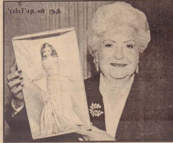
மரணம்வரை நீடித்தது. தனது மகள் பார்பராவின் நினைவாகவே தான் வடிவமைத்த பொம்மைக்கு 'ப்ரீ' என்று பெயரிட்டிருந்தார் ரூத்.

உலகப் புகழ்பெற்ற 'ப்ரீ' பொம்மைகளை உருவாக்கிய ரூத் ஹேண்ட்ஸ் என்ற அமெரிக்கப் பெண்மணி தனது 85ஆவது வயதில் லொஸ்ஏஞ்சல்ஸ் நகரில் புற்று நோயால் காலமானார். இவர் 1954ஆம் ஆண்டு 'ப்ரீ' பொம்மையை வடிவமைத்தார். 1959 ஆம் ஆண்டு அமெரிக்காவில் இடம்பெற்ற பொம்மைக் கண்காட்சியில் அறிமுகப்படுத்தப்பட்டபோது ஒரே ஆண்டில் 3 லட்சம் 'ப்ரீ' பொம்மைகள் விற்பனையாகிச் சாதனை படைத்தன. பின்னர் 150 நாடுகளில் 100 கோடி பொம்மைகள் விற்பனையாகின.