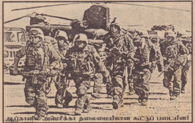
ஆப்கானிஸ்தானில் அமெரிக்கா தலைமையிலான கூட்டுப் படையினர்

காபூல், மே 1 ஆப்கானிஸ்தானின் கிழக்குப் பகுதியில் நேற்றுமுன்தினம் இரவும், நேற்று அதிகாலையும் இடம்பெற்ற