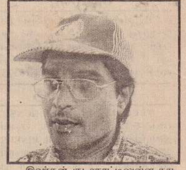
இவர்கள் குடாநாட்டிலுள்ள நாடகக் கலைஞர்களுடன் சந்திப்புகளை நடத்திவருகின்றனர். படீசார்த்த முறையில் நேர்சொள் எப்படும் இந்தப் படப்பிடிப்புக்கு ஒத்துழைப்பு நல்குமாறு 'சக்தி' மற்றும் 'சிரச' நிறுவனங்களின் சார்பில் குடாநாட்டுக் கலைஞர்களிடம் வேண்டுகோள் விடுக்கப்பட்டிருக்கிறது. (ஐ)