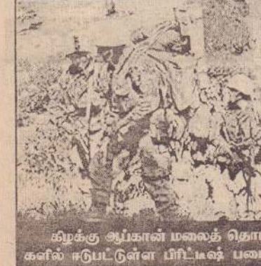
கிர்க்கு ஆப்கானில் மலைத் தொடர்களில் தேடுகையில் ஈடுபட்டிருக்கின்ற பிரிட்டன் படைப்படைவிகள்.

காபூல், மே 3 ஆப்கானிஸ்தானில் இன்னும் மறைந்து கொண்டுள்ள அல்கெய்தா தீவிரவாதிகளை தேடிக்கண்டு பிடித்துக் கைது செய்வது அல்லது அழிப்பது என்ற நோக்குடன் அங்குள்ள பிரிட்டிஷ் துருப்பினர் நாட்டின் கிழக்கு மலைத் தொடர்களில் இராணுவ நடவடிக்கைகளை ஆரம்பித்துள்ளனர்.