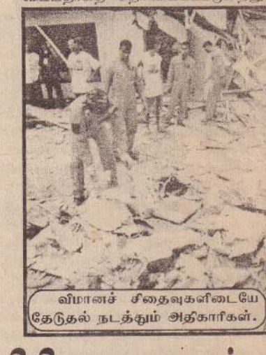
விமானச் சீதைவுகளிடையே தேடுதல் நடக்கும் அதிகாரிகள்.

யேற முயன்றார். எனினும் அதற்கிடையில் விமானம் வெடித்தச் சிதறி விட்டதாகத் தெரிவிக்கப்படுகிறது.