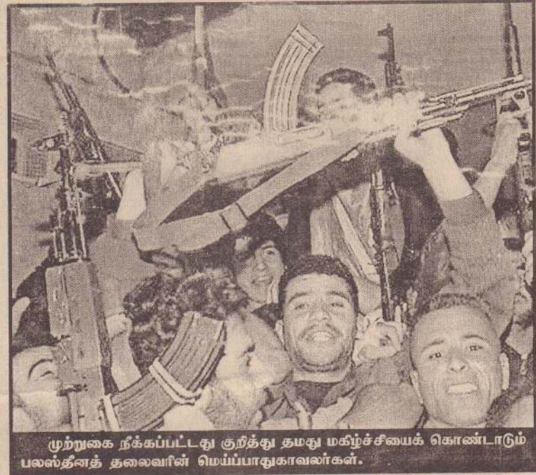
முற்றுகை நீக்கப்பட்டது குறித்து தமது மகிழ்ச்சியைக் கொண்டாடும் பலஸ்தீனத் தலைவரின் மெய்ப்பாதுகாவலர்கள்.

இதேவேளை - இஸ்ரேல், பலஸ்தீன நகரான துல்கரத்தில் தனது இராணுவ நடவடிக்கைகளை மேற்கொண்டு வருகின்றது. டாங்கிகள், கவசவாகனங்கள் சகிதம் அந்த நகருக்குள் புகுந்த இஸ்ரேலியர்கள் அங்கு கண்முடித்தனமாகப் பலஸ்தீனர்களைக் கைது செய்து வருவதாக செய்திகள் தெரிவிக்கின்றன. (ம)