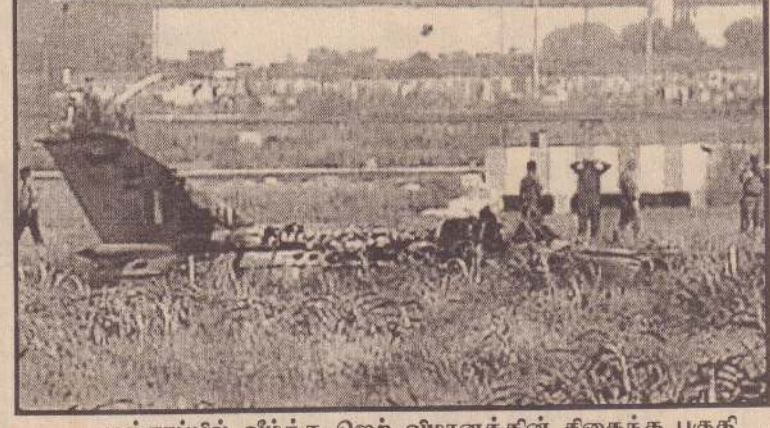
பஞ்சாப்பில் வீழ்ந்த ஜெர் விமானத்தின் சீதைந்த பகுதி