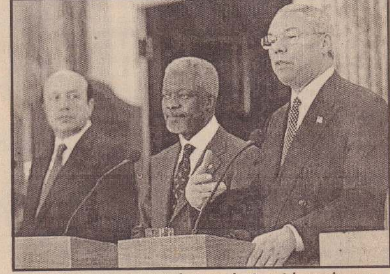
அமெரிக்க வெளிவிவகாரச் செயலர் கொலின் பவல், ஐ.நா. பொதுச் செயலர் கோபி அனான், ரஷ்ய வெளிவிவகார அமைச்சர் கிகோர் இவானோவ் ஆகியோர் கிணைந்து நடத்திய செய்தியாளர் மாநாட்டில்....

புறத்தில் இஸ்ரேலிய இராணுவம் பலஸ்தீன நகர்களில் தமது இராணுவ நடவடிக்கைகளைத் தொடர்ந்து வருகின்றது. நேற்று வெள்ளிக்கிழமை 50 இஸ்ரேலிய டாங்கிகள் பலஸ்தீன நகரான நட்லஸீனுள் புகுந்து நடவடிக்கையால் ஈடுபட்டன. அங்கு நடந்த துப்பாக்கிச் சண்டையில் பலஸ்தீனப் பொலீஸார் ஒருவர் கொல்லப்பட்டார். இதற்கிடையில் - பலஸ்தீனத்தின் ஜெனின் அகதி முகாமில் இடம்பெற்ற படுகொலைகள் மற்றும் அழிவுகள் குறித்து விசாரிப்பதற்காக நியமிக்கப்பட்ட ஐ.நா. குழுவைக் கலைத்துவிட்டதாக ஐ.நா. பொதுச் செயலர் கோபி அனான் அறிவித்துள்ளார். (ம)