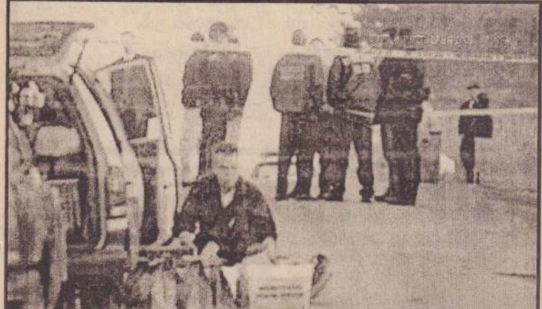
அமெரிக்காவில் தபால்பெட்டி வெடி குண்டு வெடித்த இடம் ஒன்றில் புலனாய்வு அதிகாரிகள் நடவடிக்கை மேற்கொள்வதைப் படத்தில் காணலாம்.

அதற்கேற்றதாக இல்லை. பிரபலமான ஒரு மனிதனைக் கொன்று உலகின் கவனத்தை ஈர்ப்பது போன்று பிரபலமற்ற மனிதர்களை பெரும் எண்ணிக்கையில் கொன்று அதே அளவில் கவனத்தை ஈர்க்க முடியும்.