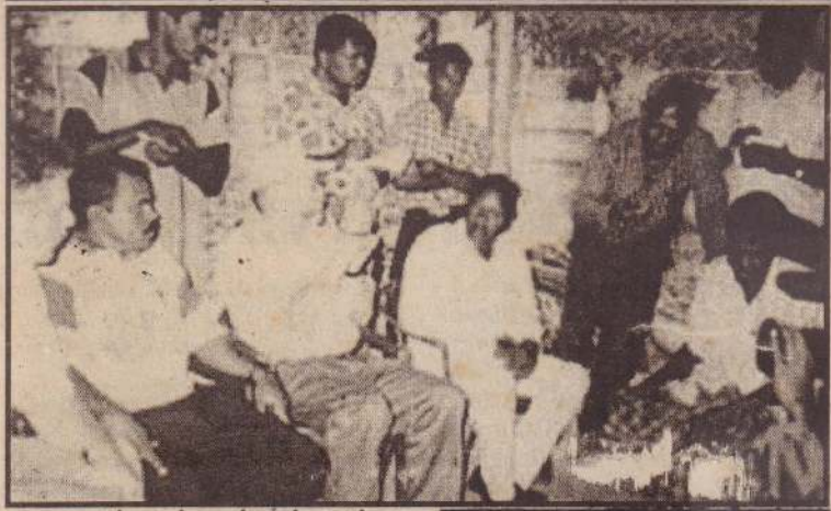
வாகரையில் நடந்த சம்பவம் குறித்து கண்காணிப்புக்குழு அலுவலர் மீனவர்களிடம் விசாரணை நடத்துகிறார்.