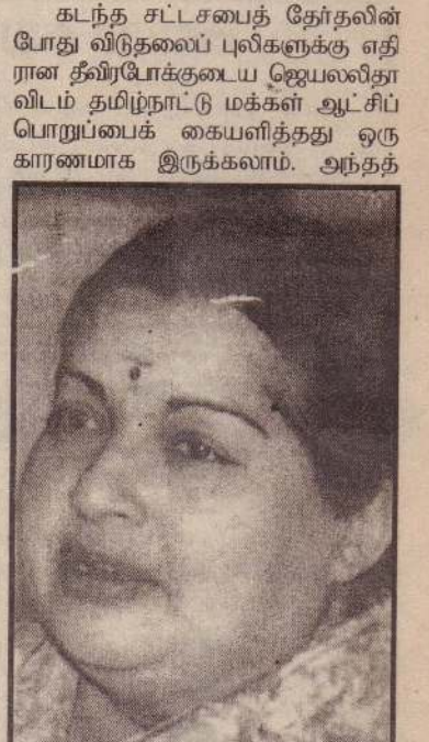
தேர்தலின் போது தி.மு.க. ஓரளவிற்கு விடுதலைப் புலிகளுக்கு ஆதரவான போக்கை கடைப்பிடித்தது எனக் கூறப்படுகிறது.