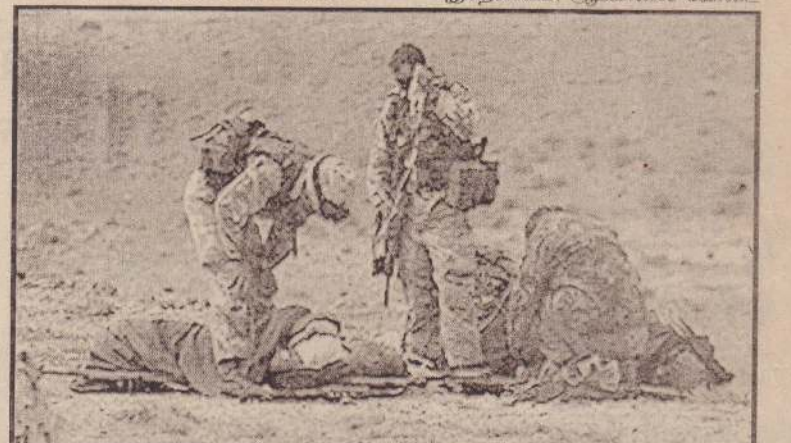
அப்கானிஸ்தானின் வரண்ட மலைப் பகுதியில் நிறுப்பால் பாதிக்கப்பட்ட மீட்டப்பட்ட வீரர் ஒருவருக்கு முதலுதவி வழங்கப்படும் காட்சி.

'கலஸ்கிசோல்' ரகத் துப்பாக்கிக் குப் பயன்படுத்தப்படும் இரண்டாயிரம் தோட்டாக்களும் விமான எதிர்ப்புப் பிரங்கி ஒன்றும் கைப்பற்றப்பட்டதாகத் தெரிவிக்கப்பட்டது. இதேசமயம், அப்கானில் கோண்டி