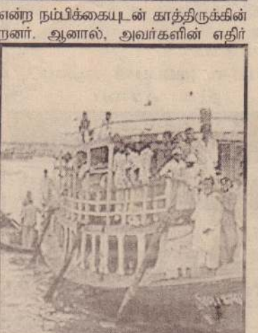
பங்களாதேஷில் அளவுக்கு அதிகமான பயணிகளுடன் செல்லும் படகு ஒன்று.

துக்கு இதுவரை 500 ரூபா அபராதம் தீர்ப்பு 1 வருடச் சிறையே தண்டனையாக வழங்கப்பட்டது. இதனால் கடுமையாக்கி, வல்லுறவுக் குற்றத்துக்கு 10 வருடங்கள் வரை சிறைத்தண்டனை வழங்கப்படும். பாலியல் பலாத்காரத்துக்கு உள்ளாக்கப்படும் சமயத்தில் தன்னை பாதுகாத்துக்கொள்ள ஒரு பெண் கொலையும் செய்யலாம். வல்லுறவுக் குட்படுத்தப்பட்ட ஒரு மனித்யியாலத் துக்குள் வல்லுறவு புரிந்தவனைக் கொன்றாலும் அது குற்றமாகாது. மேலும் ஒரு பெண்ணை வல்லுறவுக்கு ஆளாக்கியவனின் சொத்தில் பாதி பாதிப்படைந்த பெண்ணுக்கு சேரும் - இவ்வாறு நீதிமன்றம் கூறியது. இத்தீர்ப்பை நேபாள நாடாளுமன்றம் மூலம் சட்டமாக்கும்படியும் நீதிமன்றம் தெரிவித்துள்ளது. (ஓ)