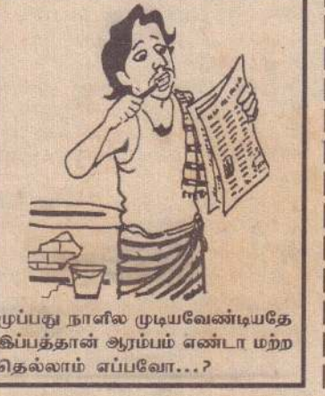
முப்பது நாளில் முடியவேண்டியதே இப்பத்தான் ஆரம்பம் என்பது மற்ற தெல்லாம் எப்போ...?