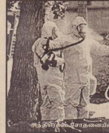
அந்திரெக்ஸ் சோதனையில் ஈடுபட்டிருக்கும் பணியாளர்கள்

பட்ட கடிதங்கள் அமெரிக்காவின் பிரதான அலுவலகங்கள் பலவற்றுக்கு அனுப்பப்பட்டிருந்தன. அதனால் இது தீவிரவாதிகளின் செயலாக இருக்கக்கூடும் என்று சந்தேகிக்கப்பட்டது.