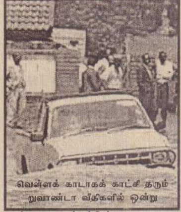
வெள்ளக் காடாகக் காட்சி தரும் றுவாண்டா வீதிகளில் ஒன்று

புதைந்து 15பேர் இறந்துள்ளனர். இதேசமயம் நைரோபியில் கடும் வரட்சி காரணமாக குடிதண்ணீர் பற்றாக்குறை ஏற்பட்டுள்ளது.