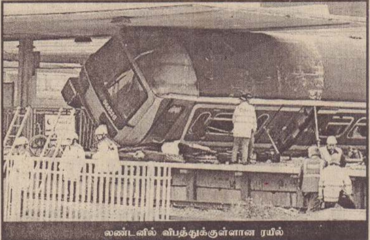
லண்டனில் விபத்துக்குள்ளான ரயில்

ரயில் பாலம் ஒன்றுடன் மோதியதால் லேயே இந்தச் சம்பவம் நடைபெற்றுள்ளது. ஆயினும் ரயில் சாரதிகாயம் எதுவும் இன்றி தப்பியுள்ளனர். ஹொல் பகுதியில் இருந்து நண்பகல் 12.45 மணிக்கு புறப்பட்ட ரயிலே விபத்தில் சிக்கியுள்ளதாக அறிவிக்கப்பட்டுள்ளது.