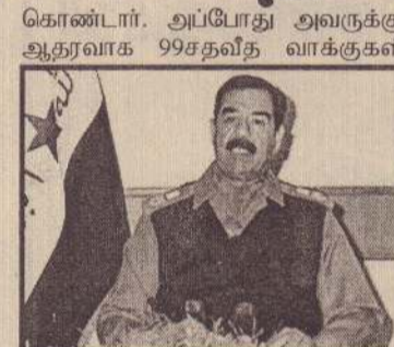
கிடைத்தன. 65வயதான சதாம் ஹுசைன் அதிபர், பிரதம மந்திரி, 'இராணுவத்

கொண்டார். அப்போது அவருக்கு ஆதரவாக 99சதவீத வாக்குகள்