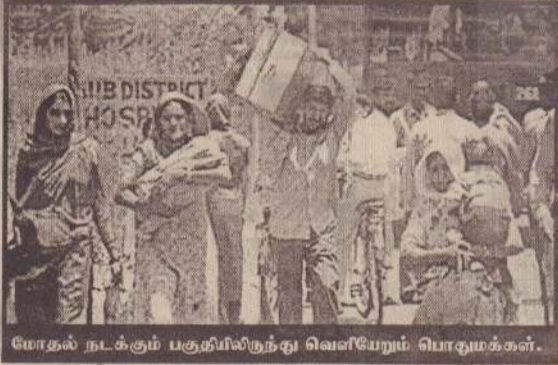
மோதல் நடக்கும் பகுதியிலிருந்து வெளியேறும் பொதுமக்கள்.

துப்பாக்கிச் சமரில் ஈடுபட்டு வருகின்றனர். இந்தியாவுக்கான பாகிஸ்தானியத் தூதரை இந்தியா வெளியேற்றியதை அடுத்து மூண்ட இந்த மோதல் நேற்றுத் தொடர்ந்தது.