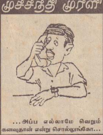
...அப்ப எல்லாமே வெறும் கனவுதான் என்று சொல்லுவீங்கோ...

மீதான தடையை அரசு முற்றாக நீக்கும் படசத்தில் பேச்சு ஆரம்பமாகும் தடை இன்னும் நீக்கப்படவில்லை; புரிந்துணர்வு உடன்படிக்கை தடுமாறிக் கொண்டிருக்கிறது. உடன்படிக்கையை வெற்றிகரமாக நடைமுறைப்படுத்துவதற்கு உறுதுணை புரியவேண்டியவர்கள் முப்படையினர். அவர்களே உடன்படிக்கையை மீறி நடந்து வருகிறார்கள். புரிந்துணர்வு உடன்படிக்கைப்படி, அது கைச்சாத்தாகி ஒரு மாத காலத்தில் வணக்கத் தலங்களில் முகாமிட்ட (10ஆம் பக்கம் பார்க்க)