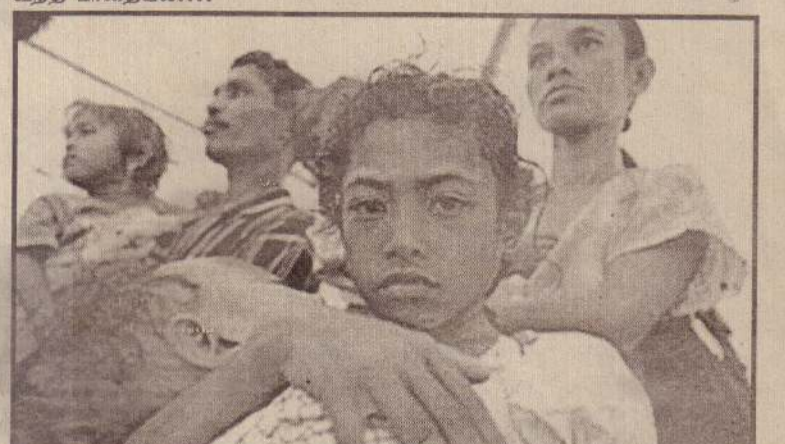
இந்தோனேஷிய ஆதரவுக் குழுக்களின் வெறியாட்டத்தால் 2லட்சம் கிழக்குத் தீமோரியர்கள் அகதிகளானார்கள்.

மரபணு மற்றும் தடயவியல் பரிசோதனைகள் முடிந்து, அந்த அழிக்கைகள் பெறப்பட்ட பின்னரே இது தொடர்பாக முடிவெடுக்கப்போவதாக அமெரிக்கா தெரிவித்துள்ளது.