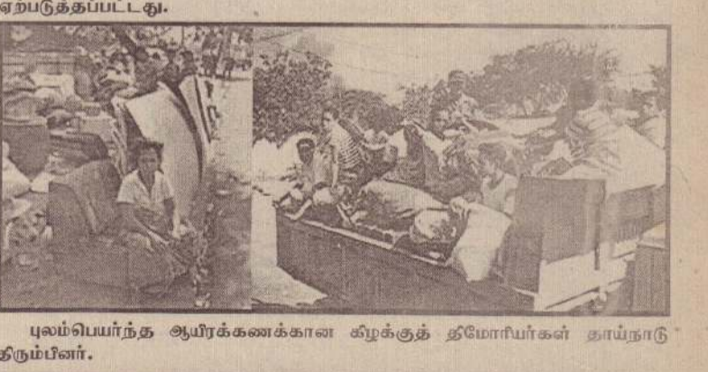
புலம்பெயர்ந்த ஆயிரக்கணக்கான கிழக்குத் தீமோரியர்கள் தாய்நாட்டிற்கும்பினர்.