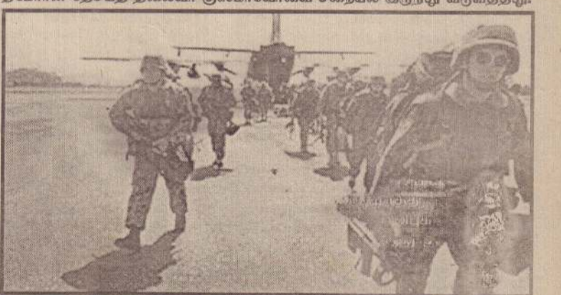
ஐ.நா. அமைதிப்படை ஆஸ்திரேலிய இராணுவத் தலைமையில் 1999 செப்டெம்பரில் கிழக்குத் தீமோரின் தரையிறங்கியதை அடுத்து ஐ.நா. நிர்வாகம் ஏற்படுத்தப்பட்டது.