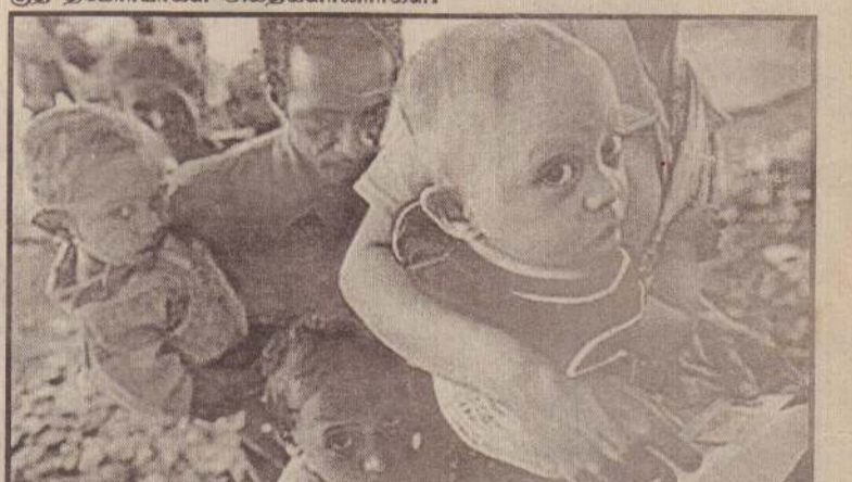
1999இல் கிடம்பெற்ற சர்வஜனவாக்கெடுப்பில் 99 விதமான தீமோரியர்கள் சுதந்திரத்துக்கு ஆதரவாக வாக்களித்தனர்.