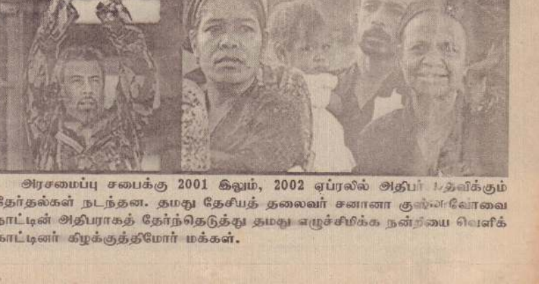
அரசமைப்பு சபைக்கு 2001 கிளும், 2002 ஏப்ரலில் அதிபர் பதவிக்கும் தேர்தல்கள் நடந்தன. தமது தேசியத் தலைவர் சனானா குஸ்மாவோவை நாட்டின் அதிபராகத் தேர்ந்தெடுத்து தமது எழுச்சிக்க நன்றியை வெளிக்காட்டினார் கிழக்குத் தீமோர் மக்கள்.