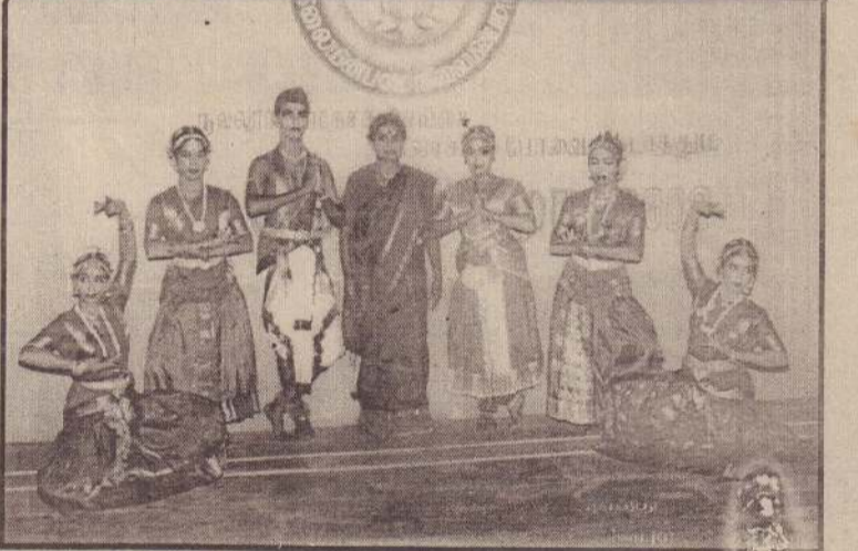
நல்லூர் பிரதேச செயலக கலாசாரப் பேரவை நடத்திய கலாசார விழா அண்மையில் நல்லூர் இளங்கலைஞர் மன்றக் கலா மண்டபத்தில் நடைபெற்றது.

கடந்த வெள்ளிக்கிழமை நீர் கொழும்பு நீதிவான் இந்த உத்தரவைப் பிறப்பித்தார். (ஏ-4)