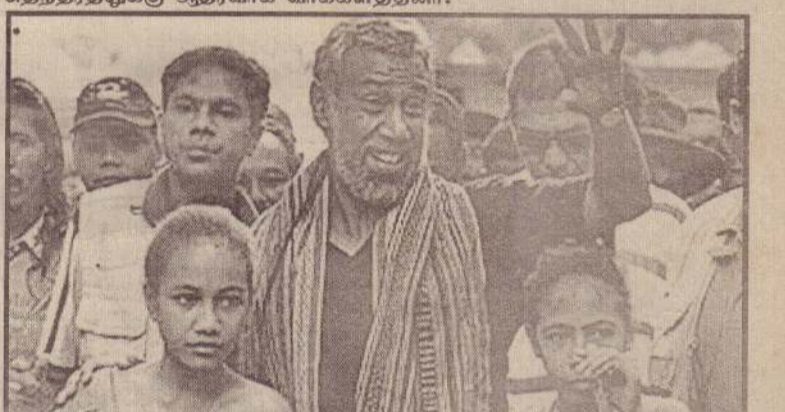
மக்கள் சக்தியைக் கண்டு மிரண்டுபோன இந்தோனேஷிய அரசு, கிழக்குத் தீமோரின் தேசியத் தலைவர் குஸ்மாவோவை சிறையில் கிருந்து விடுவதற்கு.