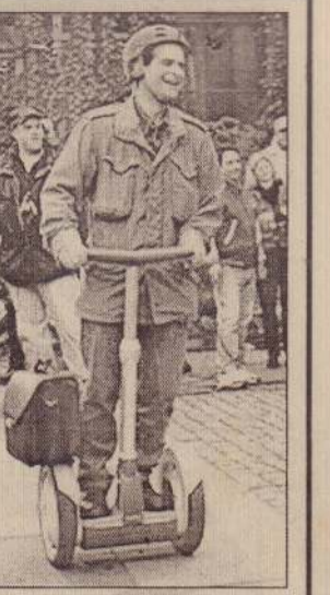
இணைக்கப்பட்டுள்ள இலகுவான மோட்டார் சாதனங்கள். இவைதான் இந்த ஸ்கட்டர்கள்

இரு சிலவகை, அவற்றை இணைத்தபடி மேல்நோக்கி வளர்ந்துள்ள ஒரு தண்டு போன்ற 'பார்' (Bar), அதில் பொருத்தப்பட்ட கைப்பிடி, கீழே சிலவகைக்கு இடையில் ஒருவர் நின்று கொண்டு பயணிக்கக் கூடிய வகையில் பொருத்தப்பட்டுள்ள மிதிபலகை அத்துடன் இணைக்கப்பட்டுள்ள இலகுவான மோட்டார் சாதனங்கள். இவைதான் இந்த ஸ்கட்டர்கள்