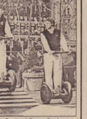
இணைக்கப்பட்டுள்ள இலகுவான மோட்டார் சாதனங்கள். இவைதான் இந்த ஸ்கட்டர்கள்

மொத்த உருவம். ஜாலியாக நின்றபடி சுமார் 12 மைல் வேகத்தில் இதில் பயணிக்க முடியும். "நீங்கள் நின்றபடி ஒரு இராஜகுமாரன் போன்ற மற்றவர்களை அவதானித்தபடி - அவர்களும் உங்களைக் கண்கொட்டாமல் பார்ப்பார்கள் - இராஜபயணம் ஒன்றை அனுபவிக்கலாம்" என்கிறார் இதனை உருவாக்கிய காலமென். வயோதிபர்கள் மத்தியில் இதற்கு ஏகப்பட்ட வரவேற்பும்.