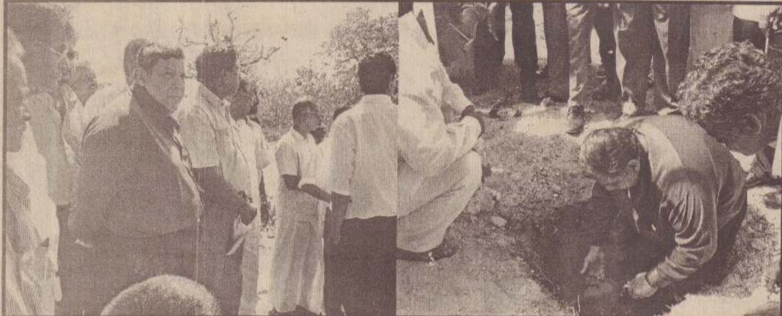
நேற்று யாழ்ப்பாணம் வந்திருந்த நகரப் பொது வசதிகள் அமைச்சர் மொஹமட் மக்ரூப் காரைநகரில் கிளுவனைக் கேணியைப் பார்வையிடுவதையும், காரைநகருக்கான குடிதண்ணீர் திட்டத்துக்கான அடிக்கல்லை நட்டு வைப்பதையும் படங்களில் காணலாம்.

வந்துசேர்ந்த அமைச்சர், முதலில் காரைநகர் கிளுவனைக் கேணியைப் பார்வையிட்டார். அந்தக் கேணியில் இருந்து காரைநகருக்கு குடிதண்ணீர் வழங்க நூறு லட்சம் ரூபா செலவிலான திட்டம் ஒன்றை அங்குராப்பணம் செய்துவைத்தார். அதன் பின்னர் யாழ்.செயலகம், யாழ்.ஆஸ்பத்திரி ஆகியவற்றுக்கும் அமைச்சர் சென்றார். குருநகர் வீ.மையூத் திட்டத்தை பார்வையிட்ட அமைச்சர் பின்னர் சாவகச்சேரிக்குச் சென்று அங்கு ஏற்பட்ட அழிவுகளைப் பார்த்தார். (ம-3-13-31-51-73)