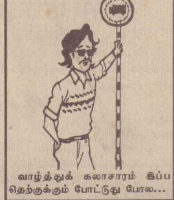
வாழ்த்துக் கலாசாரம் இப்பதெற்குக்கும் போட்டுது போல...