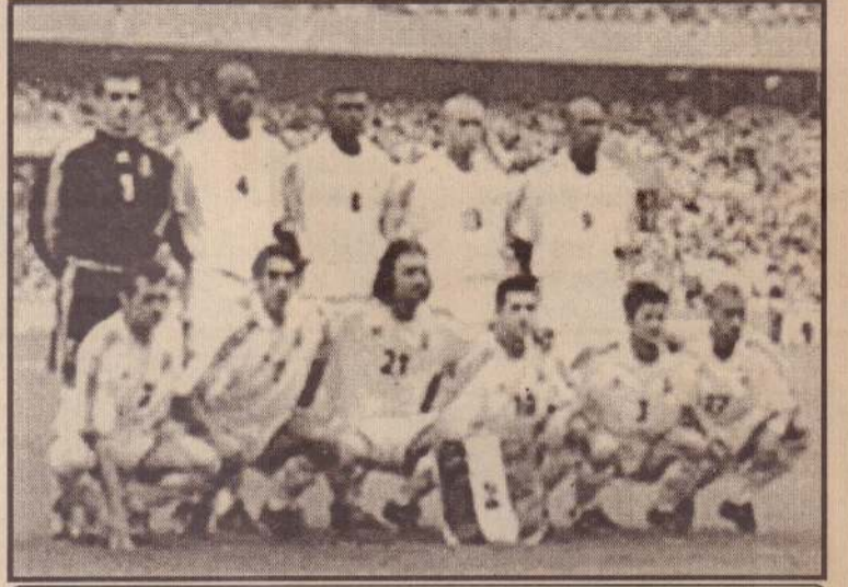
கின்றைய முதலாவது ஆட்டத்தில் கலந்துகொள்ளும் பிரான்ஸ் நாட்டு அணி