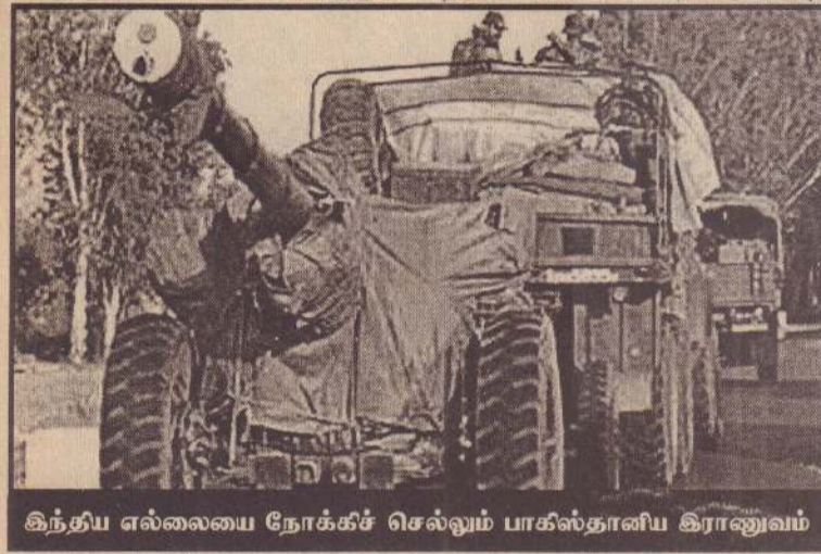
இந்திய எல்லையை நோக்கச் செல்லும் பாகிஸ்தானிய இராணுவம்

சம்பவம் இடம்பெற்றது. பாதுகாப்புத்துறை அலுவலகங்களும், பொலீஸாரின் தங்குமிடங்களும் அமைந்துள்ள இந்த முகாமை திடீரெனச் சூழ்ந்த தீவிரவாதிகள் கையெறி குண்டுகள், சிறிய ரக மோட்டார்கள் குண்டுகள் மற்றும் துப்பாக்கிகளைப் பயன்படுத்தி தாக்குதலை மேற்கொண்டதாகவும் -