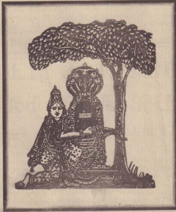
வில்வை மரத்தானை வெவ்வினைகள் களைவானை அல்லும் பகலுமெங்கள் தொல்லையற அருள்வானை பொல்லா வினையகல புங்கங்குளத்தூர் புகுந்து கல்லும் கச்சிந்துருக பாவிகள் நாம் பணிந்தீடுவோம்!

அழகிய பெருந்தெரு, அதனை அண்டியிருக்கும் ஒரு புனிதமான குச்சொழுங்கை, அறிவும் ஆற்றலும் தெய்வீகமும் நிரம்பியிருக்கும் மக்கள் சூழ்ந்த அயல். இத்தனைக்கும் நடுவிலே அமைந்திருக்கும் அற்புத மரத்தோப்புகள். இதிலே உயர்ந்து ஓங்கி வளர்ந்திருக்கிறது அம்மனுக்குப் பிடித்தமான ஒரு வில்வமரம். இந்த மரத்தின் அடியிலேதான் அம்பாளின் வதிவிடம் தென்படலாயிற்று. அக்காலத்தில் இந்த வளவுக்குள் குடியிருந்த அடியவர்கள் அம்மனின் அருளையும் அருட்தோற்றத்தையும் அற்புதங்களையும் பல தட