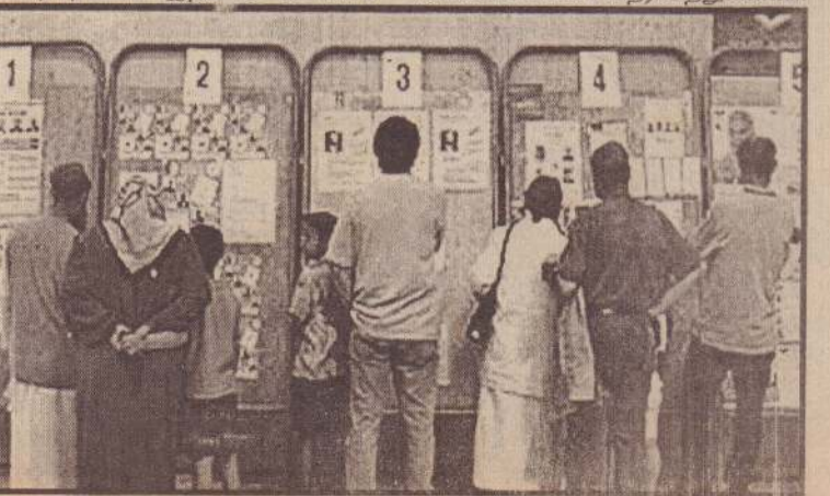
வேட்பாளர்களின் பிரகாரங்களை வாசீக்கும் அல்ஜீரிய மக்கள்.

ஆனால் வாக்களிப்பின் போது வாக்காளர்கள் மிரட்டப்பட்டமை, வாக்குச் சீட்டு போசடிகள் ஆகியவை இடம்பெற்றதாக தேர்தல் கண்காண்பாளர்கள் தெரிவித்துள்ளனர்.