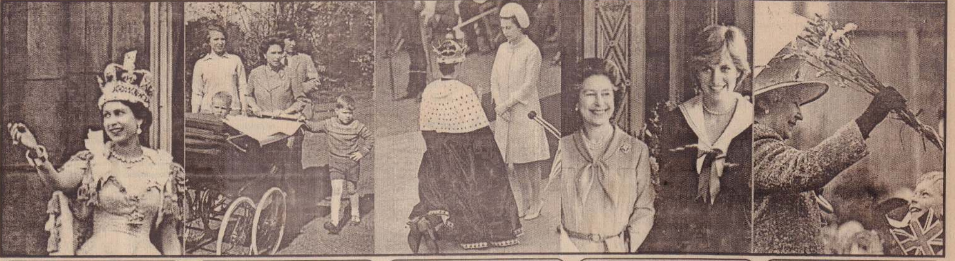
1952 ஜூன் 2ஆம் திகதி முடிசூடிய மகாராணி பக்கிஷ்லாம் அரண்மனையில் மக்களின் வழித்தை ஏற்கிறார்.