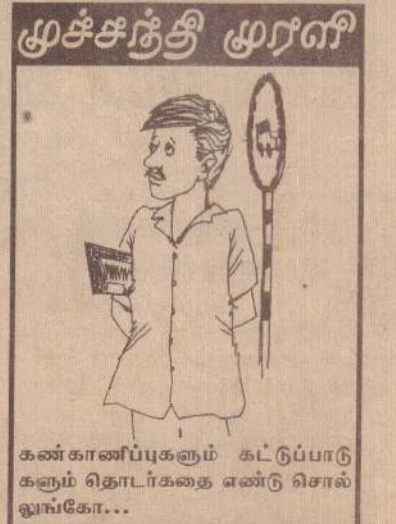
கண்காணிப்புக்கும் கட்டுப்பாடுகளுக்கும் தொடர்பை எண்டு சொல்லுவதோ...

ஐ.தே.கவின் மத்திய குழுவின் கூட்டம் இன்று பிற்பகல் கட்சித் தலைமையகமான றிகோத்தாவில் நடைபெறவுள்ளது. அந்தக் கூட்டத்தில் அமெரிக்காவுடனான உடன்படிக்கை, திருமலை எண்ணெய்க்குதம் வாடகைக்குக் கொடுக்கும் விவகாரம் என்பன தொடர்பாக (12ஆம் பக்கம் பார்க்க)