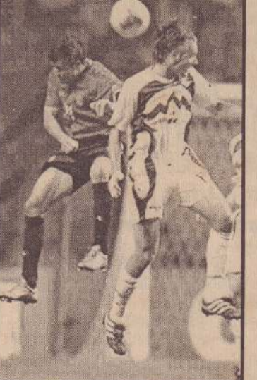
ஸ்பெயின் - ஸ்லோவேனியா அணிகளிடையேயான ஆட்டத்தில் ஒரு காட்சி.

ஸ்பெயின் அணியின் ரவல் ஆட்டத்தின் முதல் பாதியில் ஒரு அற்புதமான கோலை அடித்தார். பின் பாதியில் அந்த அணியின் கார்லோஸ் வாலோரான்ஸ் இரு கோல்களை அடித்து அணியின் வெற்றியை உறுதிப்படுத்தினார். ஆட்டத்தின் 87 ஆவது நிமிடத்தில் கலோவேனிய அணியின் ஆட்டக்காரர் பெர்ணான்டோ தன் அணி சார்பில் ஒரு கோலை அடித்தார். இறுதியில் ஸ்பெயின் அணி 3-1 என்ற அடிப்படையில் வெற்றி பெற்றது. (ம)