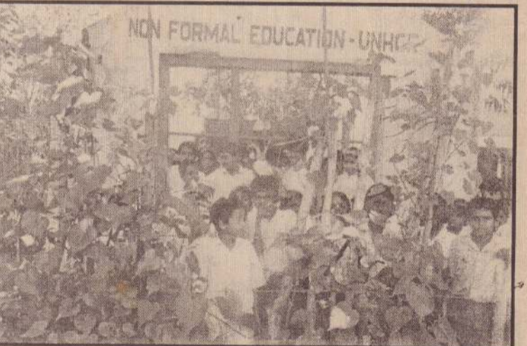
கிளிநொச்சி புனித பற்றிமா ரோ.க.பாடசாலையின் தற்போதைய தோற்றத்தைப் படத்தில் காணலாம். கிளிநொச்சி மீது கிராணுவம் மேற்கொண்ட 'சத்திஜய' கிராணுவ நடவடிக்கை காரணமாக பெரும் அழிவுகளைச் சந்தித்த கிப்பாடசாலை தற்போது பல வசதியினங்களுடன் கியங்கிவருகிறது. (ம)