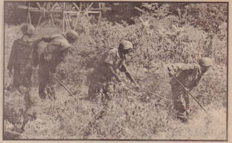
டனவாக இருக்கும். எனவே, அவற்றைப் புதைக்கப்பட்ட நிலையில் கைவிடுவது புத்திசாதரியமான எண்ணமாக இராது. மனித நடமாட்டமுள்ள இடங்களில் இருந்து அவை உடன

உபகரணத்தின்மூலம் கண்ணிவெடிகளைத் தேடுமபோது கண்ணிவெடிகள் வெடிக் காம்புக்கள் அதிகம் உள்ளன. தமது அயலவர்களைக் கண்ணிவெடியில் இருந்து காப்பாற்ற