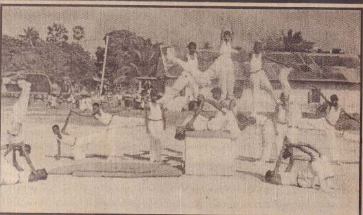
நாவாந்துறை ரோ.க.வித்தியாலயத்தில் அண்மையில் நடைபெற்ற கில்ல மெய்வன்மைப் போட்டியின் கிடைவேளை நிகழ்ச்சியின்போது வித்தியாலய மாணவர்கள் கலந்துகொண்ட உடற்பயிற்சிக் கண்காட்சியைப் படத்தில் காணலாம். (ம-51)