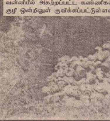
வன்னியில் அகற்றப்பட்ட கண்ணிகள் குழி ஒன்றினுள் குவிக்கப்பட்டுள்ளன.

ற் சென்று தாமே கண்ணிவெடியில் அகப்பட்ட இளைஞர், யுவதிகள் அப்பகுதியில் ஏராளம். மீட்கப்படும் கண்ணிகள் நிலக் கண்ணிகளை அகற்றுவதில் பயிற்சிகளைப் பெற்ற வல்லுநர்கள் நிலக்கண்ணிகள் புதைக்கப்பட்ட இடங்களைக் கண்டறிந்து, அந்தக் கண்ணிகளை வெடிப்பதற்கு இடமளிக்காது அகற்றுக்கின்றனர். அதன் பின்னர் அந்தக் கண்ணிகளைச் செயல்படுத்தச் செய்து பல்வேறு இடங்களில் குவிக்கின்றனர். இவ்வாறான குவியல்கள் பலவற்றைத் தற்போது கிளிநொச்சிப் பகுதியில் காணமுடிகிறது. மீட்கப்பட்ட சுமார் 20 ஆயிரம் நிலக்கண்ணிகள் அப்பகுதியில் உள்ளன. அப்பகுதிகளில் முன்று மொழிகளிலும் எழுதப்பட்ட அறிவிப்புகளைக் காணமுடிகிறது. "அபாயம், கண்ணிவெடிகள் கவனம்" என அந்த அறிவிப்பில் எழுதப்பட்டுள்ளது. இவ்வாறான அறிவிப்புகளை நாட்டின் வேறுபகுதிகளில் காணமுடியவில்லை. இவ்வாறான அறிவிப்புகள் உலகில் எந்தப் பகுதியிலாவது நாட்டப்படுவதை விருப்பாத 125 நாடுகள் உடன்பாடு ஒன்றைக் காணமுடியின்றன. 1997இல் கனடாவில் ஓட்டாவா நகரில் கைச்சாத்தான நிலக்கண்ணித் தடை உடன்பாட்டில் அமெரிக்கா கைச்சாத்திடவில்லை. இருப்பினும், சிறிலங்காவில் கண்ணிவெடிகளை அகற்றும் பணிக்கான செலவினை அமெரிக்காவே மேற்கொள்கிறது. யுத்தத்தில் ஈடுபடும் இருதரப்