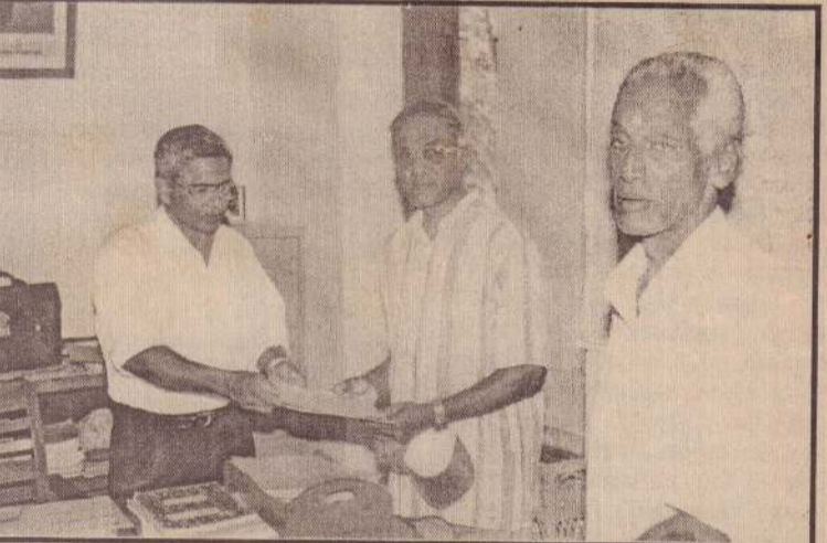
தொல்புரம் வீக்கனேஸ்வர வித்தியாலயத்திற்கு மைதானம் ஒன்றை அமைப்பதற்காக வித்தியாலய அபிவிருத்திக் குழுவினரால் அண்மையில் காணீ ஒன்று கொள்வனவு செய்யப்பட்டு பாடசாலைக்கு வழங்கப்பட்டது.