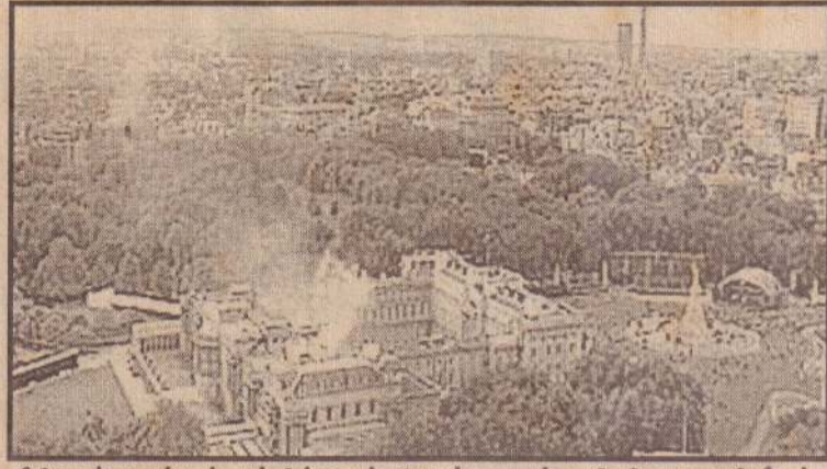
தயினால் லண்டன் பக்கிங்ஹாம் அரண்மனைக்கு மேலே புகைமூட்டம்.

சுடர்:17 வள்ளுவர் ஆண்டு 2033 வைகாசி 20 திங்கட்கிழமை (03-06-2002) UTHAYAN - A Lively National Tamil Daily கதர்:190