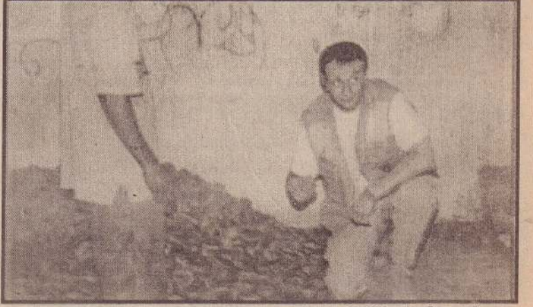
பாரும் பயன்படுத்தும் மிக மலீவான ஆனால் மிக ஆபத்தான யுத்த உபகரணம் நிலக் கண்ணிவெடிகளாகும். யுத்தம் முடிவடைந்த பின்னர் துப்பாக்கிகள் ஓய்வெடுக்கின்றன. இருப்பினும், யுத்தம் முடிவடைந்தாலும் யுத்த காலத்தில் புதைக்கப்பட்ட நிலக் கண்ணிவெடிகள் வெடிப்பதைத் தடுக்கவே முடியாது.