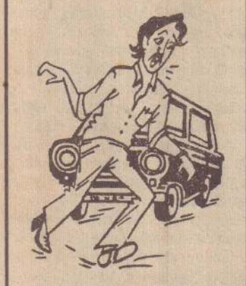
அப்ப தடை நீக்கமெல்லாம் வெளி நாட்டுக் காரருக்குத்தான் என்று சொல்லுவார்களோ...