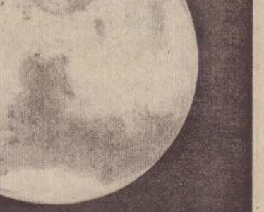
செவ்வாயின் ஒரு கோளம்

பிடிக்கப்பட்டுள்ள பனிப்பாறையானது நிலத்துக்குக் கீழே சுமார் மூன்று அடி (ஒரு மீற்றர்) ஆழத்தில் இருக்கிறது. செவ்வாயில் 60 பாகை தெற்காக இது காணப்படுகிறது. இந்தப் பனிப்பாறை உருகினால் சுமார் 500 மீற்றர் விஸ்தீரணமுள்ள கடல் தோன்றலாம் என்கின்றனர் விஞ்ஞானிகள். இதனைவிட கண்டுபிடிக்கப்பட்ட பனிப்பாறை குறித்து விஞ்ஞானிகளுக்கு மற்றுமொரு சந்தேகமும் இருக்கின்றது. அதாவது கண்டுபிடிக்கப்பட்ட பனிப்படிமமானது ஏன் ஒரு பனிமலையின் நுனிப் பகுதியாக