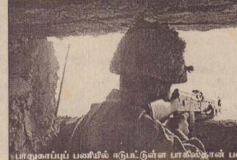
பாதுகாப்புப் பணியில் ஈடுபட்டுள்ள பாகிஸ்தான் படை வீரர்

படையினர் அறிவித்துள்ளனர். இதுதொடர்பாக வெளியிடப்பட்ட அறிக்கையில் நீலம் பள்ளத்தாக்கின் ரவலாகோட் மற்றும் கோட்லி பகுதிகளில் இந்திய இராணுவம் நடத்தி ஷெல் தாக்குதலில் 6 பாகிஸ்தானியப் பொதுமக்கள் உயிரிழந்ததுடன் 11 பேர் காயமடைந்தனர். இதற்குப் பதிலடியாக பாகிஸ்தானிய இராணுவம் மேற்கொண்ட தாக்குதலில் இந்திய இராணுவத்தின் முகாம் ஒன்றும் பதங்குழிகளும் அழிக்கப்பட்டன. இந்தியப் பகுதியில் தீ கொளுந்து விட்டு எரிந்தது. இதில் 35 இந்திய வீரர்கள் கொல்லப்பட்டனர் என்று பாகிஸ்தானிய இராணுவம் தெரிவித்தது. (ஏ)