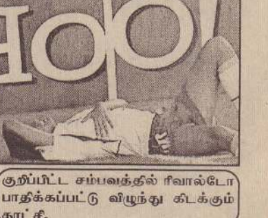
குறிப்பிட்ட சம்பவத்தில் ரிவால்டோ பாதிக்கப்பட்டு விழுந்து கிடக்கும் காட்சி.

இன்று நடக்கும் ஆட்டங்கள் சியோல், ஜூன் 1 உலகக் கிண்ண உதைபந்தாட்டப் போட்டிகளில் இன்று நடைபெறும் ஆட்டங்களில் பங்குபற்றும் அணிகள், போட்டி நடைபெறும் நாடு, நேரம் (உள்ளூர் நேரம்) என்பன வருமாறு:- * ரஷ்யா எதிர் துனிஷியா (ஜப்பான் - பகல் 12.30) * அமெரிக்கா எதிர் போர்த்துகல் (கொரியா - பகல் 3.00) * ஜெர்மனி எதிர் அயர்லாந்து (கொரியா - மாலை 5.30) (ம)