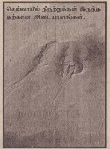
செவ்வாயில் நீருற்றுக்கள் இருக்கக்கூடிய அடையாளங்கள்.

பிரேம் கம் கவனஞ்செலுத்த ஆரம்பித்தனர். சில ஆண்டுகளுக்கு முன் அமெரிக்கா அனுப்பிய 'பாப்பைண்ட்' என்ற விசேட் இயந்திரம் செவ்வாயில் தரையிறங்கியது. செவ்வாய் குறித்த ஆய்வில் இது ஒரு சாதனையாகியது. பாப்பைண்டரின் ஆய்விலிருந்து செவ்வாயில் உயிரினங்கள் இருக்கக்கூடிய சாத்தியக் கூறுகள் மிகக் குறைவு என்று விஞ்ஞானிகள் கண்டு கொண்டார்கள். இதனால் அவர்களது உற்சாகம் வடிந்துபோனது.