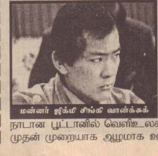
மன்னர் ஜிக்மி சிங்கி வாணக்கக் முடிசூடிக் கொண்டதன் 30 ஆம் ஆண்டு நிறைவை அந்நாட்டு மக்கள் கோலாகலமாகக் கொண்டாடுகின்றனர்.

மன்னர் ஜிக்மி சிங்கி வாணக்கக் முடிசூடிக் கொண்டதன் 30 ஆம் ஆண்டு நிறைவை அந்நாட்டு மக்கள் கோலாகலமாகக் கொண்டாடுகின்றனர். பூங்குடி மக்கள் நிறைந்த நாபான பூட்டானில் வெளி உலகத் தொடர்புகள் முதன் முறையாக அழமான ஊடுருவி இருப்பதால், மன்னரின் முடிசூட்டு விழா கொண்டாட்டங்கள் சர்வதேச ஊடகங்களில் இடம்பெற்றுள்ளன. வழக்கமாக பூட்டானின் பாரம்பரிய முறைப்படி மூங்கில்களால் தயாரிக்கப்பட்ட அம்பு, வில்களை பயன்படுத்தி நடத்துபடும் விருட்டோடியில் இந்த வருடம் ஒலிம்பிக் போட்டிகளில் பயன்படுத்தப்படும் உபகரணங்களே வில்வீரர்களால் பயன்படுத்தப்பட்டதாகக் கூறப்படுகிறது. இமயமலையின் மடியில் பின்தங்கியிருந்த பூட்டான் நவநாகரிக உலகுடன் இணையத் தொடங்கிவிட்டதையே இது எடுத்துக் காட்டுகிறது. (ஏ)