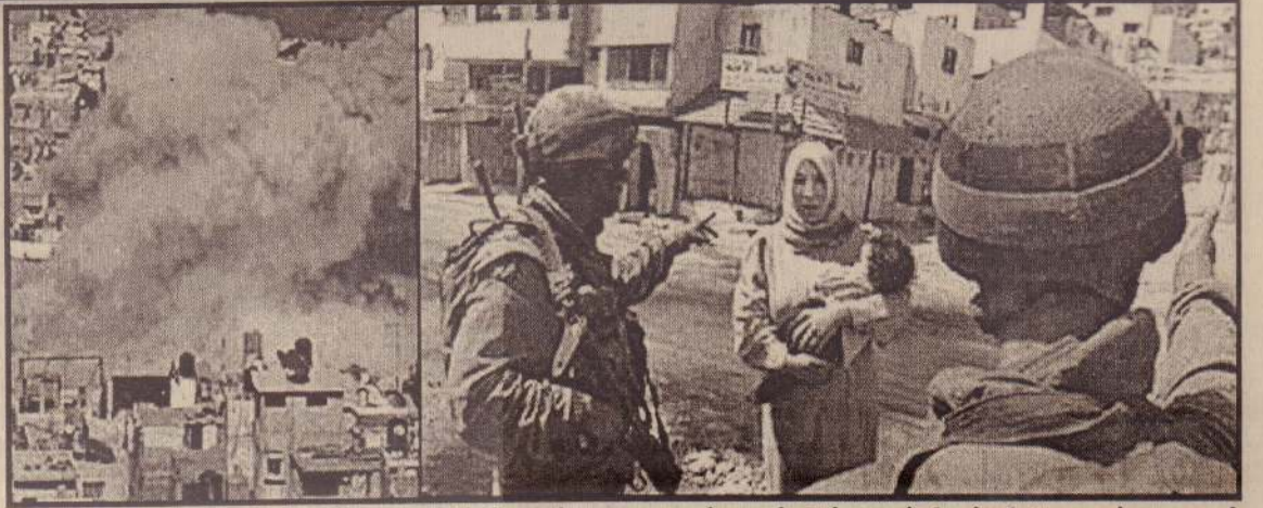
கிஸ்ரேலிய அமைச்சர் படுகொலையில் தொடர்புடையதாகக் கூறப்படும் பலஸ்தீனத் தீவிரவாதத் தலைவர் அஹமட் சதாத் தலைமையிலான விரிவாக்கத் தீர்மானத்தை அடுத்து பலஸ்தீனருக்கு எதிரான தனது கிராணுவ நடவடிக்கையை கிஸ்ரேல் தீவிரப்படுத்தியுள்ளது. துல்கராமில் பலஸ்தீனத் தீவிரவாதத் தலைவர் ஒருவரின் வீடு கிஸ்ரேலிய கிராணுவத்தினர் தாக்குதலில் எரிவதையும் கிஸ்ரேலியப் படையினர் வீதிக் கட்டுப்பாட்டை தன்குழந்தையுடன் அத்துமீற எத்தனிக்கும் பெண்மணியையும் படங்களில் காணலாம்.

தொகை அபராதம் ஆகியவற்றை தண்டனையாக பெறக்கூடும். இதேசமயம், கடந்த ஒரு தசாப்த காலமாக சுவிஸ்லாந்தில் பரவலாக கருச்சிதைவுகள் செய்யப்பட்டுவரும், இந்தக் குற்றத்தின் கீழ் வருக்கும் தண்டனை நிதிக்கப்படவில்லை. இந்த நிலையில், கருச்சிதைவு செய்து கொள்வதை சட்டபூர்வ விடய மாக்கும்படி சுவிஸ்லாந்தின் பல் வேறு மாகாண அரசுகளும் வலியுறுத்தி வந்தன. இதனையடுத்து இது தொடர்பான சர்வஜன வாக்கெடுப்பு கடந்த வாரம் நடத்தப்பட்டது. அதில் கருச்சிதைவை சட்டபூர்வ மாக்கவேண்டும் என்று பெரும்பாலான சுவிஸ் மக்கள் வாக்களித்துள்ளனர்.