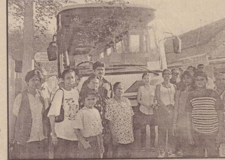
யாழ்ப்பாணத்துக்கு வருகைதந்துள்ள மலேசிய நாட்டு உல்லாசப் பயணிகள் 'உதயன்' அலுவலகத்திற்கு வந்தசமயம் எடுக்கப்பட்ட படம். 'ஜெர்வீங் ரவல்ல' நிறுவனம் இந்தப் பயணிகளுக்கான பயண ஏற்பாட்டைச் செய்திருந்தது.