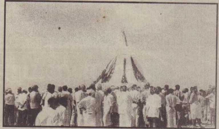
சோனப்பு மயானத்தில் தலைவர் சீவசீதம்பரத்தின் உடல் தகனம் செய்யப்பட்ட சீதையின் தோற்றம்.