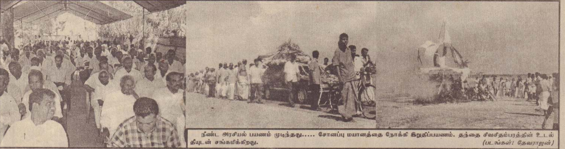
நண்ட அரசியல் பயணம் முடிந்தது..... சோனப்பு மயானத்தை நோக்கி கிறித்தப்பயணம். தந்தை சிவசிதம்பரத்தின் உடல் தீயுடன் சங்கமிக்கிறது.