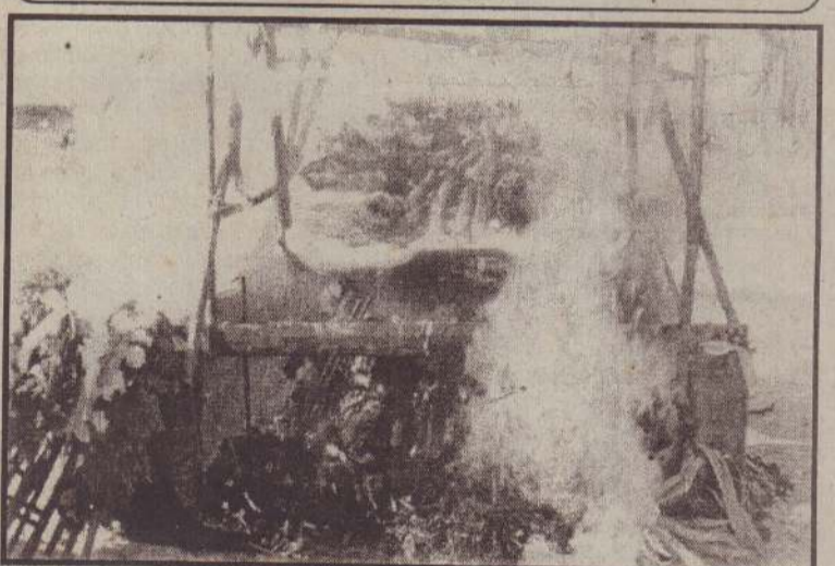
சீதை தீயில் எரிக்கின்ற காட்சி. (மேலும் படங்கள் முன்றாம் பக்கத்தில்.)