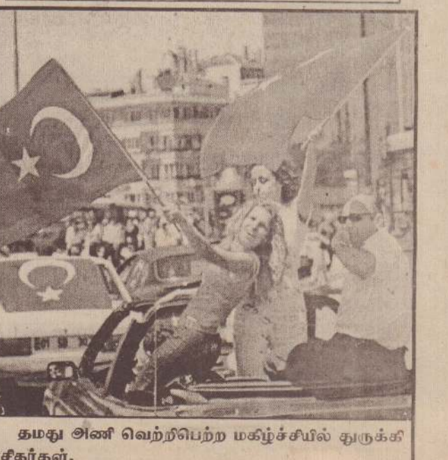
தமது அணி வெற்றிபெற்ற மகிழ்ச்சியில் துருக்கி ரசீகர்கள்.