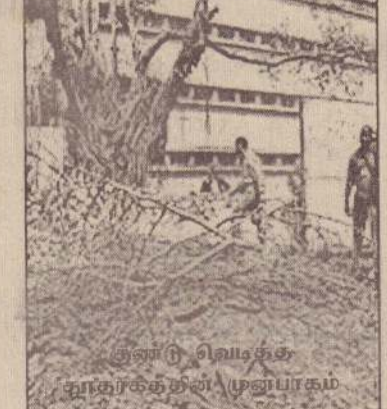
இன்று வெடித்து தூதரகத்தின் முன்பாகம்

போது பொலீஸாரால் தடுத்தாற்றுத் தப்பட்டார். இதனை எதிர்த்து வீதியோரத்தில் நிறுத்தப்பட்டிருந்த காரியேயே 9 நாள்கள் அடைந்து கிடந்து போராட்டம் நடத்தினார். இதன் பின்னர் வீட்டுக் காவலில் வைக்கப்பட்ட அவர், சுமார் 19 மாதங்களின் பின்னர், கடந்த மாத ஆரம்பத்தில் விடுவிக்கப்பட்டிருந்தார். எனவே, சூகியை சுதந்திரமாக நடமாட பர்மிய இராணுவ அரசு அனுமதிக்கின்றதா என்பதைச் சோதிக்கும் ஒரு நிகழ்வாகவும் அவரது நேற்றைய பயணம் அமைந்திருந்தது குறிப்பிடத்தக்கது. பர்மியப் பொலீஸாரோ அல்லது இராணுவத்தினரோ அவரது பயணத்துக்கு இடையூறு ஏதும் விளைவிக்கவில்லை. (ம)