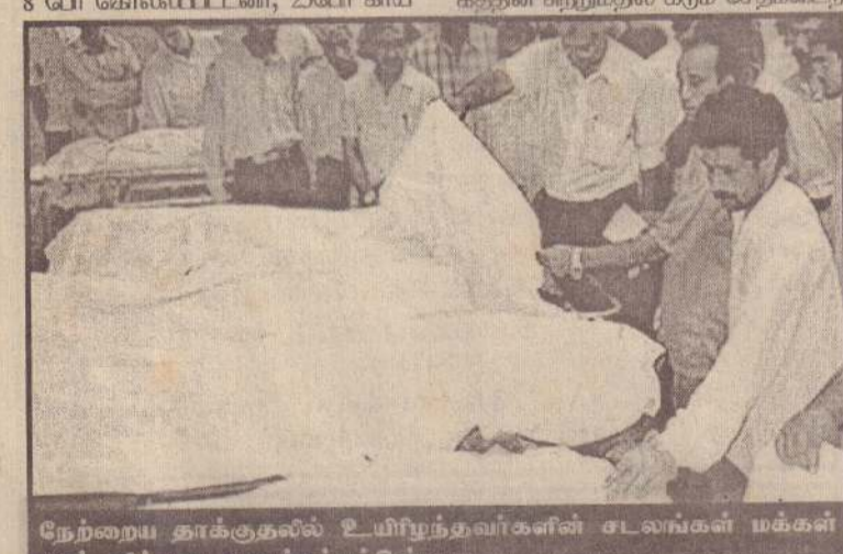
நேற்றைய தாக்குதலில் உயிரிழந்தவர்களின் சடலங்கள் மக்கள் அஞ்சலிக்காக வைக்கப்பட்டுள்ளன.

மடைந்தனர். அவர்களில் ஒரு அமெரிக்கர் உட்பட துணை தூதரகப் பணியாளர்கள் 6 பேர் அடங்கியிருந்தனர். இந்தக் குண்டுவெடிப்பினால் தூதரகத்தின் சுற்றுமதில் கரும் சேதமடைந்தது. தூதரகக் கட்டடத்தின் ஜன்னல் கண்ணாடிகள் நொறுங்கிவிழுந்தன. அங்கே நிறுத்தப்பட்டிருந்த 5 கார்களும் சேதமடைந்தன. காயமடைந்தவர்கள் அருகிலுள்ள வைத்திய சாலைகளில் சேர்க்கப்பட்டுள்ளனர். இது தற்கொலைப் படையினரின் தாக்குதலாக இருக்கலாம் என்று கூறிய பாகிஸ்தான் பொலீஸ் அதிகாரிகள், குண்டு காரில் வைக்கப்பட்டிருந்தது; ஆனால் அந்தக் கார் நிறுத்தப்பட்டிருந்தது அல்லது ஓடிக்கொண்டிருந்தது என்பது தெரியவில்லை என்றனர். அல்கெய்டா தீவிரவாதிகள் இந்த தாக்குதலுக்குக் காரணமாக இருக்கலாம் என்று பாகிஸ்தானியப் பொலீஸ் கூறுகின்றது. சென்ற மாதமும் கராச்சி நகரில் 'வெர்தான்' ஹோட்டலுக்கு வெளியே நடத்தப்பட்ட மனித குண்டுத் தாக்குதலில் 11 பிரெஞ்சு நாட்டவர்களும் 3 பாகிஸ்தானியர்களும் கொல்லப்பட்டமை குறிப்பிடத்தக்கது. (ம-9)