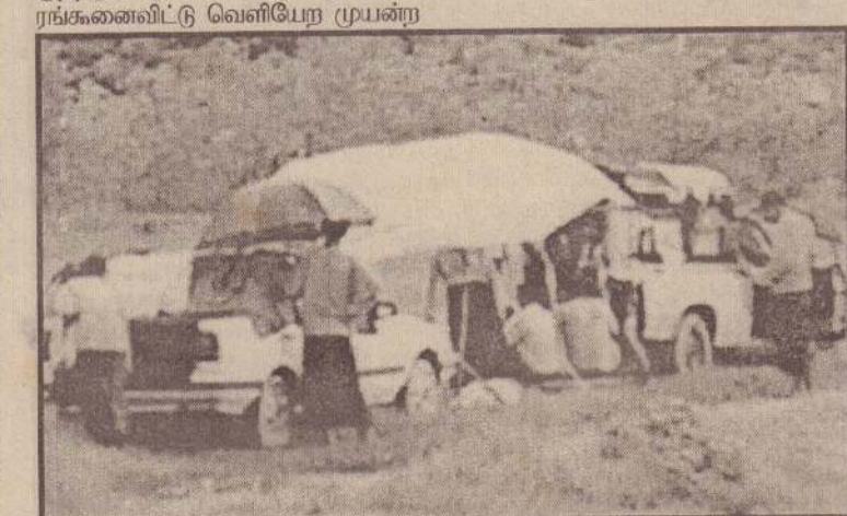
தன் வீட்டிலிருந்து பறப்பட்டுச் செல்லும் ஆங்ஷான் சூகியை வூடி அனுப்பி வைக்கும் அவரது ஆதரவாளர்கள்

மறைந்து வாழும் அல்கெய்டா தீவிரவாதிகளை அழிப்பதற்கு உயிரியல் ஆயுதங்களைப் பயன்படுத்தப் போவதாக அமெரிக்க ஜனாதிபதி ஜோர்ஜ் டபிள்யூ புஷ் எச்சரித்துள்ளார். இத்தாக்குதலிலிருந்து மக்களைப் பாதுகாக்கும் நடவடிக்கைகளைக்கான சட்டத்தில் அவர் கையெழுத்திட்டுள்ளார்.