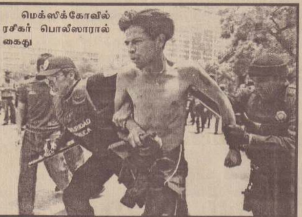
மெக்ஸிக்கோவின் ரசீகர் பொல்லாரால் கைது

இதனால் இம்முறையும் உலகக் கிண்ணத்தைக் கைப்பற்றக்கூடிய அணிகளின் வரிசையில் பிரான்ஸுக்கு முக்கிய இடம் இருந்தது. ஆனால், முதல் நாள் இடம்பெற்ற ஆரம்ப ஆட்டத்திலேயே பிரான்ஸ், அவ்வளவு பிரபலமில்லாத செனகல் அணியிடம் 1-0 என்ற கோல் அடிப்படையில் தோற்றது. பிரான்ஸின் இந்தத் தோல்வியால் ஆடிப்போனவர்கள் இந்த நாட்டு ரசிகர்கள் மட்டுமல்ல உதைபந்தாட்ட விமர்சகர்களும் கூடத்தான். பிரான்ஸ் அணியில் ஆட்டத்தை நிர்ணயிக்கும் வீரர் (play