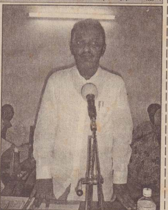
யாழ்ப்பாணத்துக்கு வருகை தந்துள்ள மக்கள் தொடர்பு அமைச்சர் சிமந்தியால் பாக்கீர் மாக்கார் யாழ்ப்பாணம், செயலகத்தில் நேற்று நடந்த கூட்டத்தில் உரையாற்றியபோது எடுக்கப்பட்ட படம்.

கொழும்பு, ஜூன் 16 நுகேகொட சந்தியில் நேற்று மாலை இடம்பெற்ற விபத்தில் வயோதிப்ப பெண் ஒருவர் கொல்லப்பட்டார். இவர் விதியைக் கடக்கையில் தனியார் பஸ் ஒன்றுடன் மோதுண்டார். மற்றும் இரு சிறுவர்கள் காயமடைந்தனர். இச்சம்பவத்தைபடுத்தி ஆத்திரமடைந்த மக்கள் அப்பகுதியால் வந்த அனைத்து பஸ்களையும் தாக்கியுள்ளார்கள். சுமார் 20 தனியார் பஸ்களும் மற்றும் சில கடைகளும் அடித்து நொறுக்கப்பட்டுள்ளன. விசே பொலீஸ் அதிரடிப் படையினரும், இராணுவத்தினரும் அப்பகுதியில் நிலைமையை கட்டுப்பாட்டிற்குள் கொண்டுவந்துள்ளனர் எனத் தெரிவிக்கப்பட்டது. (ஐ-9)