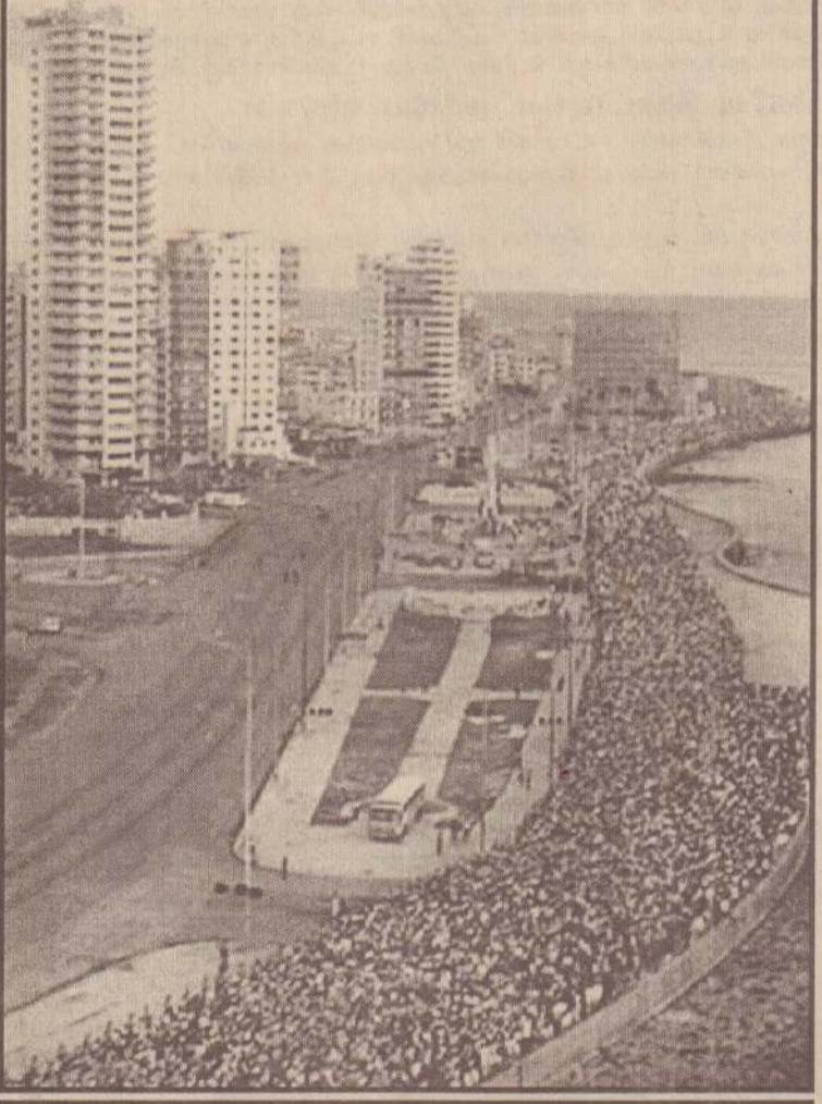
அமெரிக்காவின் செயற்பாடுகளுக்கு எதிர்ப்புத் தெரிவித்து கடந்த புதன்கிழமையன்று கியூபாவின் தலைநகர் ஹவானாவில் பத்து லட்சம் பேர் கலந்துகொண்ட பேரணியை படத்தில் காணலாம்.