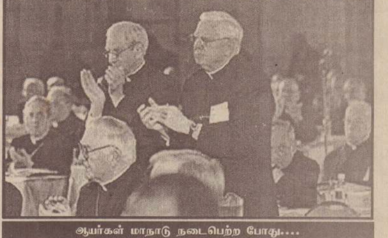
ஆயர்கள் மாநாடு நடைபெற்ற போது....