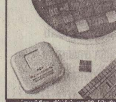
'மைக்ரோ சிப்' மாதிரி (பெரிய) நல்லாமை வடிவத்தை கிங்குள்ள படத்தின் மூலம் காணலாம். மருந்து நிரப்பப்பட்ட மைக்ரோ சிப் அரை அங்குல அளவே இருப்பதை இந்தப் படத்தின் மூலம் தெரிந்து கொள்ளலாம்.

துகளைச் சாப்பிடவேண்டும்; சிலர் தினமும் இருமுறை ஊசிமூலம் மருந்து செலுத்தும் நிலையிலும் உருவாக்கியுள்ளது. இது அளவில் மிகச் சிறியது. இந்த 'சிப்பில்' நாம் விரும்பும் மருத்துவப் பொருளை அடைத்து வைக்கமுடியும்.