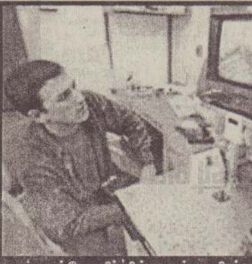
'மைக்ரோ சிப்' மருந்து நிரப்பும் பணி கம்பியூட்டர் மூலம் மேற்கொள்ளப்படுகிறது.

நீரிழிவு நோய் போன்று ஒரு சில நோய்களால் பாதிக்கப்பட்டவர்கள் தினமும் மூன்று வேளையும் மருந்து