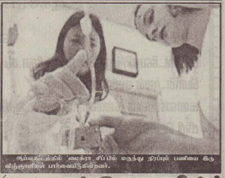
ஆய்வுகூடத்தில் 'மைக்ரோ சிப்' மருந்து நிரப்பும் பணியை இரு விஞ்ஞானிகள் பார்வையிடுகின்றனர்.