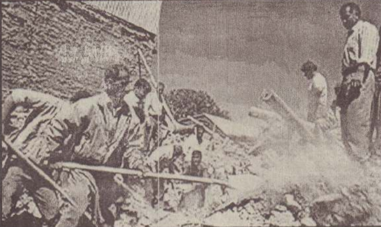
புகம்பத்தால் கிடிந்துவிழுந்த கட்டடங்களின் கிடிபாடுகளுக்கிடையே சிக்கியவர்களை மீட்கும்பணி நடக்கிறது.

மீட்புப் பணிகள் தொடர்ந்தும் இடம்பெற்று வருகின்றன. நிலநடுக்கம் பாதித்த பகுதிகளில் இருந்தவை எல்லாம் ஒருதள வீடுகள் என்பதனால் பெரும் இடிபாடுகள் வையும் ஏற்படவில்லை என்றும், அவற்றில் சிக்கிக் கொண்டுள்ளவர்கள் இன்னும் உயிருடன் இருப்பதற்கான சாத்தியங்கள் இருப்பதாகவும் மீட்புப் பணியில் ஈடுபட்டுள்ள அதிகாரிகள் தெரிவித்துள்ளனர். (ம)