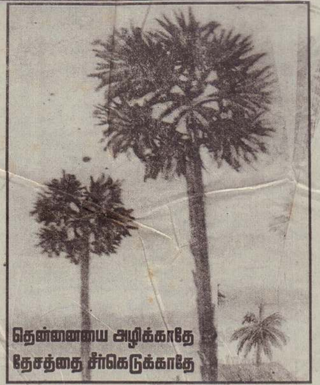
தென்னாசிய அழிக்காதே தேசத்தை சீர்கெடுக்காதே

உதயவாக்கு உயர்ந்த பண்புகளை கைவிட்டு ஒழுக்கமீறிய நடந்துகொள்பவர்கள் தேங்காய் உடைத்து, திருவிழா செய்து, தட்சணை கொடுத்து கோயில் கட்டினாலும் அவற்றை கிரைவன் ஏற்பதில்லை.