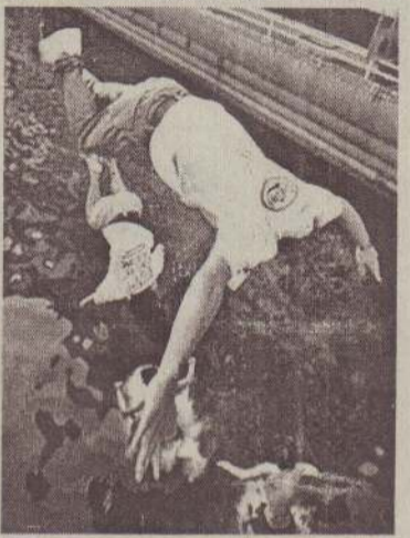
ஜப்பானின் தோல்வியை தாங்க முடியாத ரசீகர்கள் ஓடிச் சென்று ஆற்றில் குதிக்கும் காட்சி.

இரண்டாம் சுற்று 'நொக் அவுட்' முறையில் இடம்பெற்றது. இதில் இம்முறை உலகக் கிண்ணத்தை வெல்லும் அணிகளுள் ஒன்று என்று முன்னர் கணிக்கப்பட்ட இத்தாலி அணியை எதிர்த்து தென்கொரியா ஆடியது. ஆட்டநேரத்தில் இரு அணிகளும் தலா ஒரு கோல் அடித்துச் சமநிலையில் இருந்தன. இதனால் மேலதிக நேரம் வழங்கப்பட்டது. இந்த நேரத்தில் தென்கொரிய வீரர் ஆன் ஜூங் ஹுவான் பொன் கோல் (Golden Goal) அடித்து அணியை வெற்றி பெறச் செய்தார்.