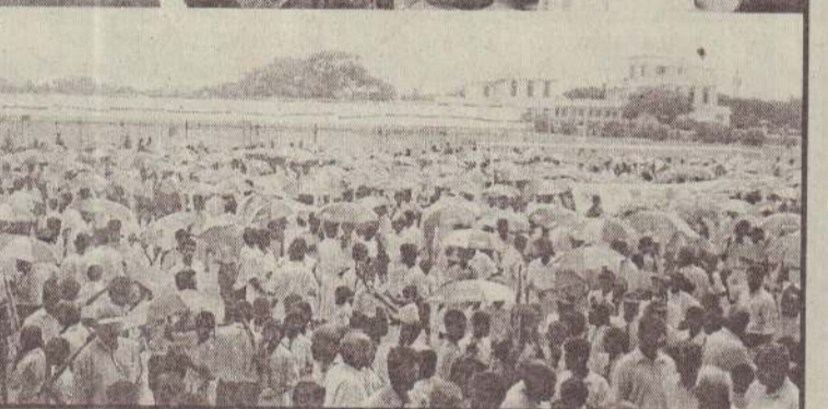
கோட்டே ஸ்ரீ ஐயவர்தனபுர லயன்ஸ் கழகத்தினால் ஒழுங்கு செய்யப்பட்ட பாடசாலை மாணவர்களுக்கு சமாதான குடை, தொப்பி வழங்கும் செயல்திட்ட நிகழ்வு நேற்று யாழ். துரையப்பா ஸ்ரேடியடித்தில் நடைபெற்றபோது எடுக்கப்பட்ட படங்களை மேலே காணலாம்.