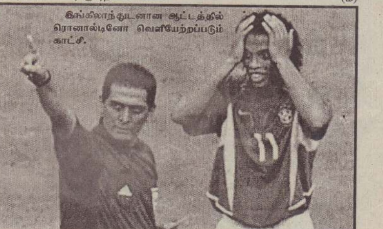
கிள்கிளாந்துடனான ஆட்டத்தில் ரொனால்டோவிடம் வெளியேற்றப்படும் காட்சி.

இங்கிலாந்துடனான கால்இறுதி ஆட்டத்தில் கோல்கம்பங்களிலிருந்து 42யார் தூரத்தில் வைத்து ரொனால்டோவிடம் அடித்த க்ரூப்பாற்ற உதை (Free kick) மூலம் கிடைத்த கோலே அணிக்கு வெற்றியைத் தேடித்தந்தமை குறிப்பிடத்தக்கது. (ம)