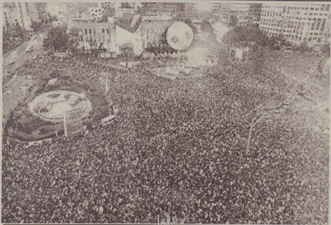
தென்கொரிய நகரொன்றில் தமது அணி வென்ற மகிழ்ச்சியைக் கொண்டாடும் மக்கள் சமுத்திரம்

பொதுவாக ஆசிய மற்றும் ஆபிரிக்க நாடுகளில் புகழ் பெற்ற வீரர்கள் பணத்துக்காகவும் சிறப்பான ஆட்ட நுணுக்கங்களைக் கற்றுக் கொள்