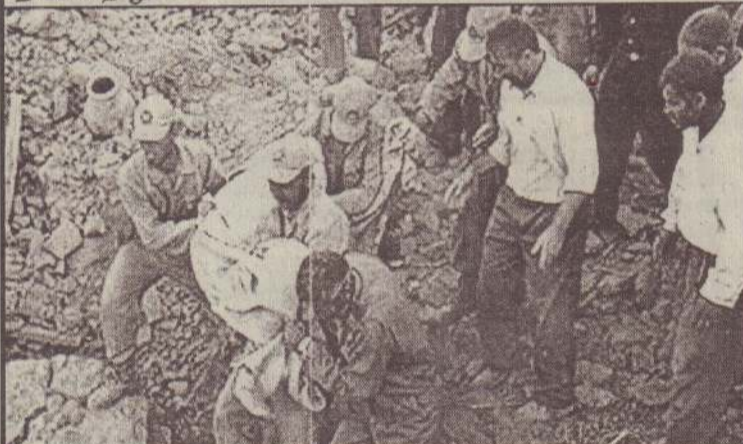
கிடிபாடுகளுக்குள் சிக்கி உயிரிழந்த ஒருவரின் சடலத்தை மீட்புப் பணியாளர்கள் தூக்கிவருகின்றனர்.