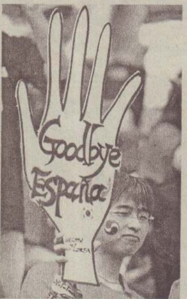
கால்இறுதி ஆட்டத்தில் ஸ்பெயின்னை தென்கொரியா வென்ற மகிழ்ச்சியில் ஸ்பெயினுக்கு விடை கொடுக்கும் தென்கொரிய ரசீகர்.

தமது அணி இத்தாலியுடனான போட்டியில் வெற்றிபெற்று இரண்டாம் சுற்றுக்குத் தகுதி பெற்றது