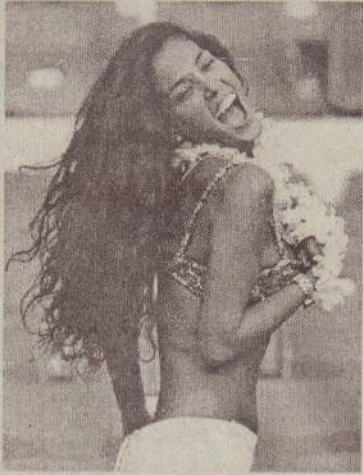
மகிழ்ச்சியில் பிரேஸில் அழகு

ஆஷுவன் எதிர்பார்க்கப்பட்ட உலகக் கிண்ண உழைப்பந்தாட்டம் முடிவறும் கட்டத்தை அடைந்துவிட்டது. நாளை செவ்வாய்க்கிழமை அரையிறுதி ஆட்டங்கள் ஆரம்பமாகின்றன. எதிர்பார்த்ததைவிட அதிகச்சிகரமான முடிவுகளுடன் இரண்டாம் சுற்றும் கால் இறுதி ஆட்டங்களும் நிறைவு பெற்றுள்ளன.