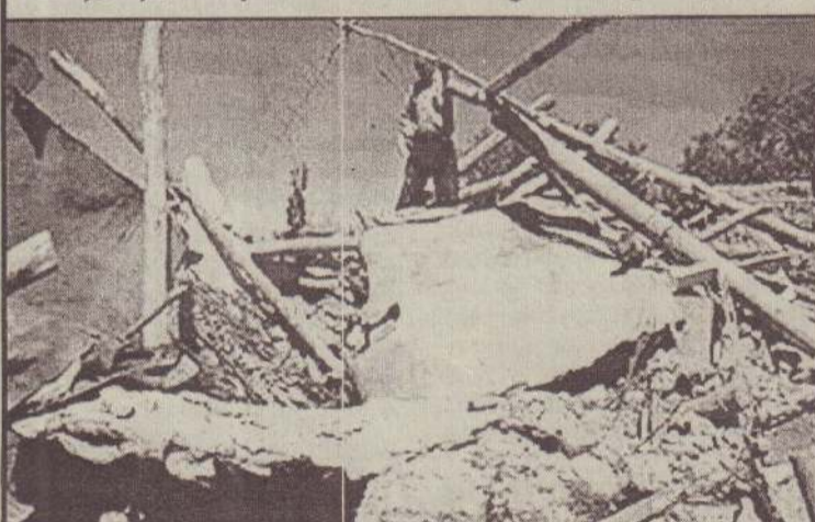
தகர்ந்த தனது வீட்டை சோகத்துடன் பார்க்கும் ஈரானியர் ஒருவர்.