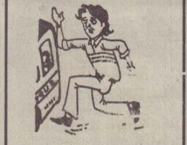
...அப்ப கழக்கு கொந்தளக்கு அண்டு சொல்லங்கோ...

கடற்போக்குவரத்து தொடர்பாக இணக்கம் கிளிநொச்சி, ஜூன் 29 விடுதலைப் புலிகளின் சுதந்திரமான கடற்போக்குவரத்துத் தொடர்பாக இணக்கம் காணப்பட்டுள்ளது என்று விடுதலைப் புலிகள் நேற்றுத் தெரிவித்தனர். கிளிநொச்சிக்கு நேற்றுமாலை (12 ஆம் பக்கம் பார்க்க)