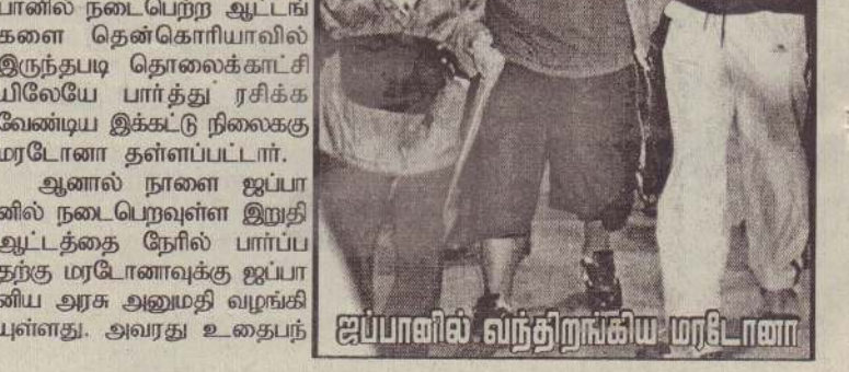
ஜப்பானில் வந்திருக்கிய மரடோனா

அனுமதி வழங்கப்பட்டதையடுத்து மரடோனா நேற்று ஜப்பானுக்கு வந்து சேர்ந்தார். இறுதி ஆட்டத்தை நேரில் பார்ப்பதற்கு தனக்கு அனுமதி அளித்தமைக்காக ஜப்பானிய அரசுக்கு அவர் நன்றி தெரிவித்தார். (ய-12)