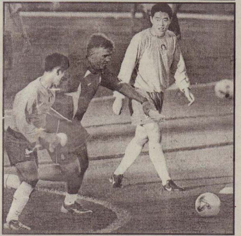
கின்ற நடக்கும் ஆட்டத்திற்காக தென்கொரிய வீரர்களைத் தயார்ப்படுத்தும் பயிற்சியாளர் கிபன்ட் (மத்தி).