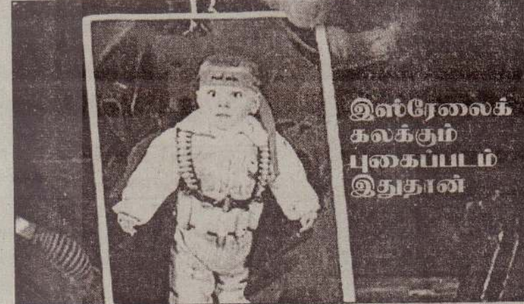
இஸ்ரேலைக் கலக்கும் புகைப்படம் இதுதான்

பலஸ்தீன 'ஹமாஸ்' இயக்கத்தின் தற்கொலைத் தாக்குதலாளிகள் பயன்படுத்தும் தற்கொலைக் குண்டு களை ஏந்தியபடி தோன்றும் புகைப்படங்கள் ஏற்கனவே வெளிவந்துள்ளன. ஆனால், வசூக் குழுவை ஒன்று