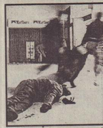
ஆர்ஜென்ரினாப் பொலீஸரின் அத்துமீறலைக் காட்டும் புகைப்படங்களில் ஒன்று. வீழும்படி கிடப்பவருக்கு உதவியவரை பொலீஸர் அடித்து கிழும்பதைப் படத்திற்கு காணலாம்.

புர்த்தும் வகையிலான 8 புகைப்படங்களை 'கிளாரின்' என்ற பத்திரிகை வெளியிட்டது. இதனையடுத்து பொலீஸாருக்கு எதிரான கண்டனங்கள் எழுந்துள்ளன. மேற்படி அத்துமீறல்கள் தொடர்பாக இரண்டு பொலீஸர்கைது செய்யப்பட்டதுடன், நூற்றுக்கும் மேற்பட்ட பொலீஸர் பணி இடைநிறுத்தம் செய்யப்பட்டுள்ளனர். (ஏ-8)