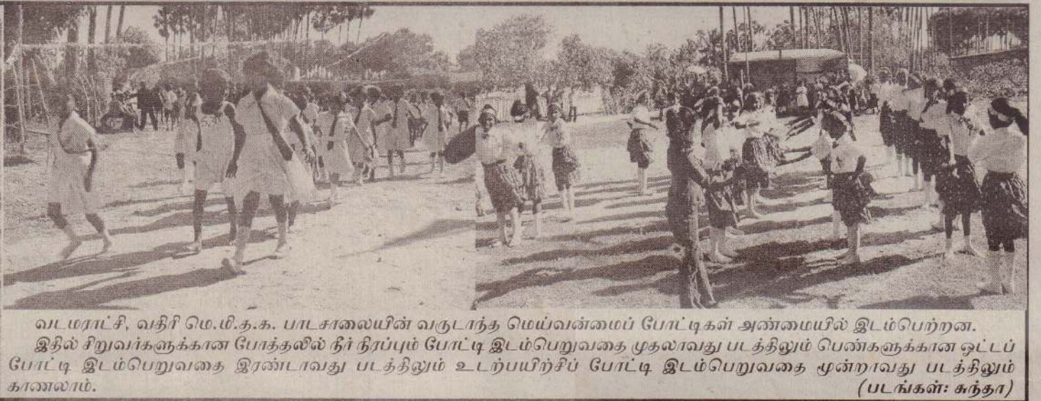
வடமராட்சி, வதிர் மெ.மீ.த.க. பாடசாலையின் வருடாந்த மெய்வன்மைப் போட்டிகள் அண்மையில் இடம்பெற்றன. இதில் சிறுவர்களுக்கான போத்தலில் தீர்நீர்ப்பும் போட்டி இடம்பெறுவதை முதலாவது படத்திலும் பெண்களுக்கான ஒட்டப் போட்டி இடம்பெறுவதை இரண்டாவது படத்திலும் உடற்பயிற்சிப் போட்டி இடம்பெறுவதை மூன்றாவது படத்திலும் காணலாம்.