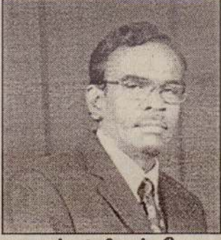
எமது கல்வியியல் பேராசான்