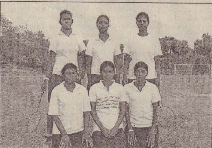
கரவெட்டிப் பிரதேச செயலகத்தினால் நடத்தப்பட்ட பெண்களுக்கான "பற்மின்டன்" 2008 இற்கான போட்டியில் வெற்றியீட்டிய "வதிரி பொமர்ஸ்" அணியினர்.

விறுவிறுப்பாக நடந்த இந்த ஆட்டத்தில் பொமர்ஸ் வெற்றி பெற்று பிரதேச சம்பியனானது. (1-70)