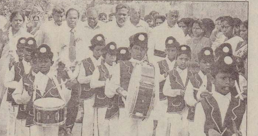
பெரியவிளாள் நோ.க.த.க. பாடசாலையின் இல்ல மெய்வன்மைப்போட்டி அண்மையில் நடைபெற்றது. நிகழ்வில் பிரதம விருந்தினராகக் கலந்துகொண்ட சண்டிலிப்பாய் கோட்டக் கல்விப் பணிப்பாளர் சி.கந்தசாமி மற்றும் விருந்தினர்கள் பாண்ட வாத்தியக்குழு சகிதம் அழைத்து வரப்படுவதைப் படத்தில் காணலாம். (202)