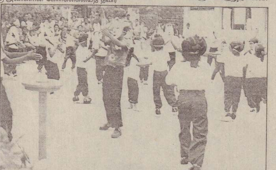
சன்னாகம் கோட்டைக்காடு அ.த.க. இல்ல மெய்வன்மைப்போட்டியில் பிராணிகளாக வேடம் போட்டு - முகமூடி அணிந்து - பாடசாலை மாணவர்கள் உடற்பயிற்சி செய்வதைப் படத்தில் காணலாம். (202)