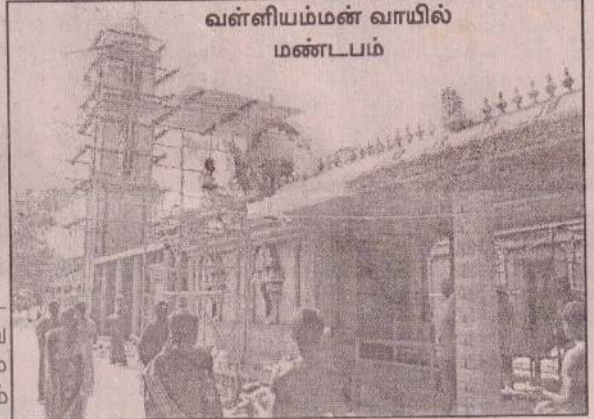
வள்ளியம்மன் வாயில் மண்டபம்

வேக நாளான அன்றுதான் இக்கலச அபிஷேகம் இடம்பெறவுள்ளது. புனருத்தாரணம் செய்யப்பட்டுள்ள ஆலயத்தின் உட்புறச் சுவர்களில் கந்தப் பெருமானின் வரலாற்றுச் சிறப்புமிக்க கதைகள் ஓவியங்களாகத் தீட்டப்பட்டுள்ளன. இவை இந்த ஆலயத்தின் அழகை மேலும் மெருகூட்டுவனவாகக் காணப்படுகின்றன. பல கோடி ரூபா செலவில் புனரமைக்கப்பட்டு இப்போது எழிற்கோலம்பூண்டுள்ளது அழகன் முருகன் - அன்னதானக் கந்தன் - உறைந்துள்ள செல்வச்சந்நிதி. எதிர்வரும் 7ஆம் திகதி உதயபூசையுடன் கும்பா