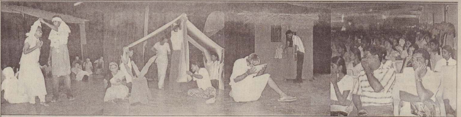
யாழ்.பல்கலைக்கழகத்தில் இடம்பெற்ற உலக நாடக விழாவில் எடுக்கப்பட்ட படங்கள் இவை. முகத்திரை, கனாமி, தடுமாற்றம் ஆகிய நாடகங்களின் காட்சிகளையும் அரங்கு நிறைந்த பார்வையாளர்களையும் இங்கே காணலாம்.