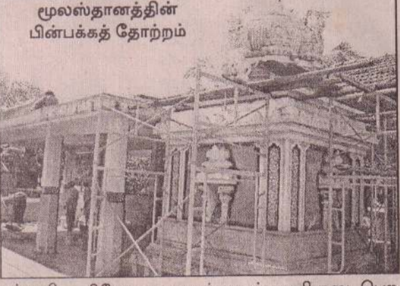
மூலஸ்தானத்தின் பின்பக்கத் தோற்றம்

நடைபெற்று முழுமையடையும் நிலைக்கு வந்துள்ளன. இந்த ஆலய பரிவார மூர்த்திகளான பிள்ளையார், முருகன், வள்ளி, ஆறுமுகசுவாமி, வைரவர், சரஸ்வதி ஆகியோருக்குத் தனித்தனிக் கோபுரங்கள் அமைக்கப்பட்டுள்ளன. இவற்றுடன் மண்டபம், காண்டாமணிக் கோபுரம் ஆகியவற்றுக்கும் சேர்த்து எட்டுக் கலசங்கள் வைக்கப்பட்டு கும்பாபிஷேகம் நடத்தப்படவுள்ளது. அச்சுவின் நட்சத்திரமும் வளர் பிறை மூன்றாம் நாளாமாசிய எதிர்வரும் 7ஆம் திகதி திங்கட்கிழமை கும்பாபிஷேகம் இடம்பெறவுள்ளது. இந்நாளிலேயே கலச அபிஷேகங்களும் நடத்தப்படவுள்ளது. 1988ஆம் ஆண்டு தொடக்கம் நடைமுறைப்படுத்தப்பட்டு வரும் கும்பாபி