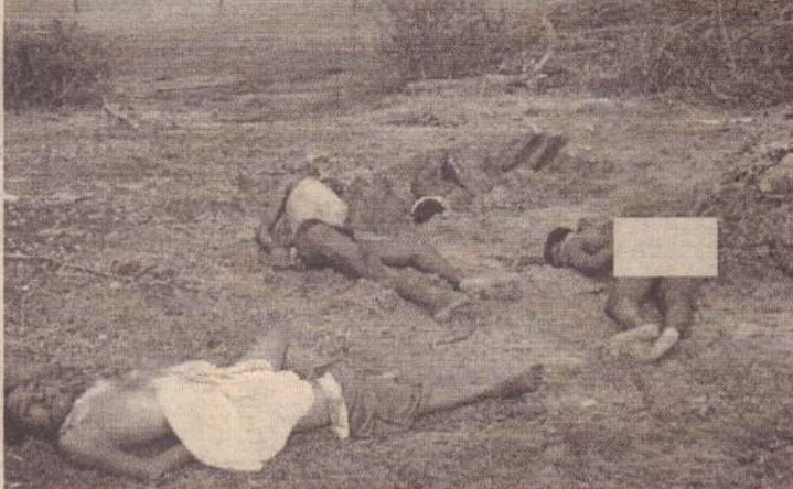
இலங்கையில் இடம்பெற்றதாகக் குற்றம்சாட்டப்படும் நீதிக்குப் புறம்பான கொலைகள் தொடர்பில் கடைசியாக வெளியிடப்பட்ட ஒளிப்பட ஆதாரம் இது. பிரிட்டனில் வெளியிடப்பட்ட இந்தப் படம் உண்மையானது அல்ல என அமைச்சர் பிரிஸ் தெரிவித்திருக்கிறார்.