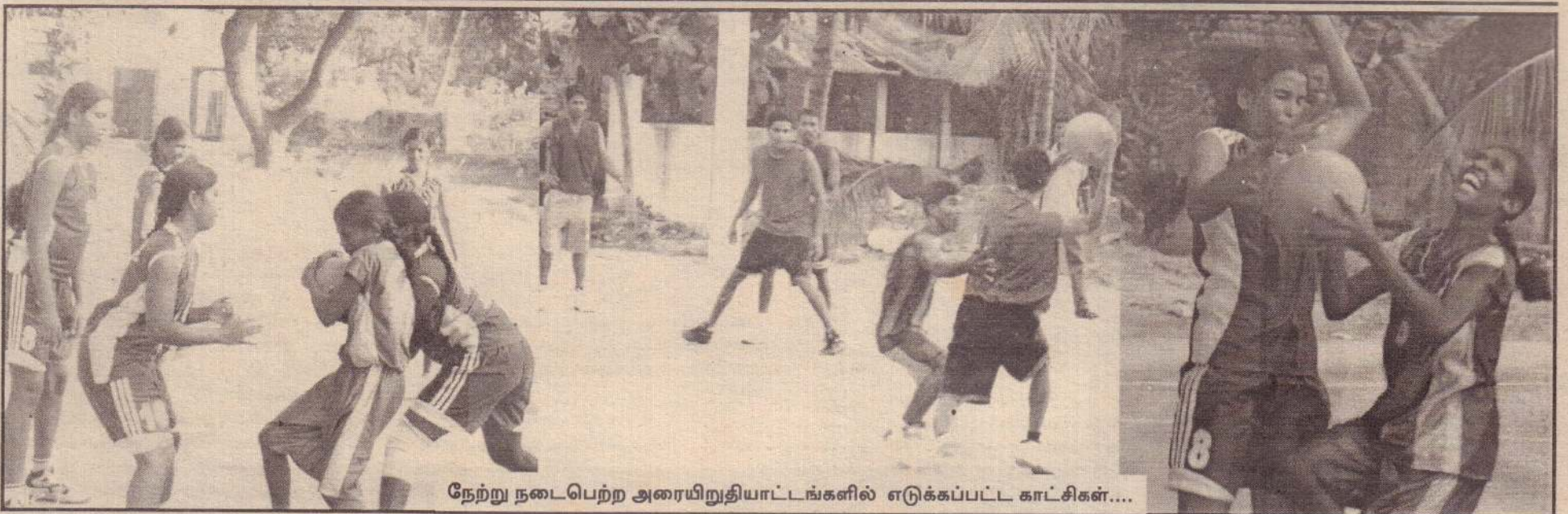
நேற்று நடைபெற்ற அரையிறுதியாட்டங்களில் எடுக்கப்பட்ட காட்சிகள்....