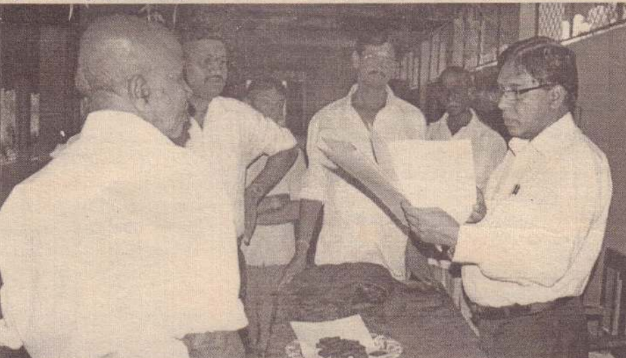
வல்வெட்டி இந்து தமிழ்க் கல்வன் பாடசாலையில் அண்மையில் இடம்பெற்ற பெற்றோர் மற்றும் பொதுமக்கள் ஒன்று கூடலில் நாடாளுமன்ற உறுப்பினர் எ.சரவணவன் பாடசாலையின் அபிவிருத்தி தொடர்பாகக் கலந்துரையாடுவதைப் பதிவு செய்த காணொலி.

காரைகா * காரை. மத்தி அபிவிருத்தி மன்றத்துக்குத் தளபாடங்கள் வழங்கல் - 50 ஆயிரம் ரூபா.