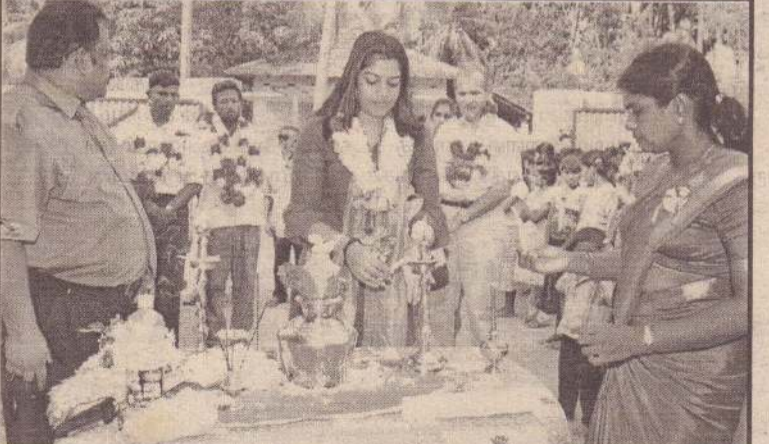
சர்வதேச சிறுவர் தினத்தை முன்னிட்டு 'கடவுளின் குழந்தைகள் நிறுவனம்' புலோலி சிறுவர் கிராமத்தில் நடத்திய சிறுவர் தின நிகழ்வில் எடுக்கப்பட்ட படம் இது.

மூலம் பாலினை அடைத்து சந்தைப்படுத்தக் கூடிய வசதியை ஏற்படுத்தித் தருமாறு இப்பகுதி மக்கள் கிராம அபிவிருத்தி உத்தியோகத்தரிடம் கோரிக்கை விடுத்துள்ளனர். கால்நடைகளைக் கட்டி வளர்க்குமாறு அறிவுறுத்தப்பட்டுள்ளது. விவசாயிகளால் பல இடங்களில் பயிரிடப்பட்ட நெற்பயிர்களை கட்டாக்காலியாக திரியும் ஆடு, மாடுகள் மேய்ந்து வருவதாகத் தெரிவிக்கப்படுகிறது. தச்சன் தோப்பு, கைதடி, தனங்கிளப்பு உட்பட பல இடங்களில் வயல்களில் பயிர்களாக விளைந்திருக்கும் நெல் நாற்றுக்களை ஆடுகள், மாடுகள் மேய்ந்து வருவதால் விவசாயிகள் கவலை தெரிவித்துள்ளனர். விவசாயிகள் இவ்வருடம் அதிகளவில் பல இடங்களில் கால்போக நெற்செய்கையில் ஈடுபட்டுள்ளமை குறிப்பிடத்தக்கது. (201-131)