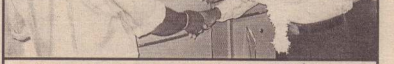
மக்கள் வங்கியின் 49 ஆவது ஆண்டு நிறைவையொட்டி சாவகச்சேரி மக்கள் வங்கிக் கிளையினர் ஒரு தொகுதி பொருள்களை சாவகச்சேரி ஆதார வைத்தியசாலைக்கு அண்மையில் அன்பளிப்பாக வழங்கியபோது எடுக்கப்பட்ட படம்.

யாழ்ப்பாணம், ஒக்.21 சித்தன்கேணி- தனுவோடைப்பதி சிவசித்தம்பரேஸ்வரப் பெருமான் ஆலய மஹா கும்பாபிஷேகம் நாளை வெள்ளிக்கிழமை முதல் 29 ஆம் திகதி வெள்ளிக்கிழமை வரை இடம் பெறவுள்ளது. பிரதிஷ்டா பிரதமகுரு வித்தியாஸாகரம் சிவபூர் சபா வாஸு தேவக் குருக்கள் தலைமையில் நிகழ்வுகள் இடம்பெறும். குடாநாட்டில் உள்ள 35 குருக்கள்மார் பங்கு பற்றி கும்பாபிஷேகத்தை சிறப்பிக்கவுள்ளார். எதிர்வரும் 29 ஆம் திகதி வெள்ளிக்கிழமை காலை 9 மணிக்கு இராஜகோபுர கலச கும்பாபிஷேகமும் தூபிகலச அபிஷேகமும் இடம்பெறும். அ த ன எ த் த ட ா ட் ற் து முற்பகல் 10 மணிக்கு மூலாலய மஹா கும்பாபிஷேகமும் இடம் பெறும். (201-302)