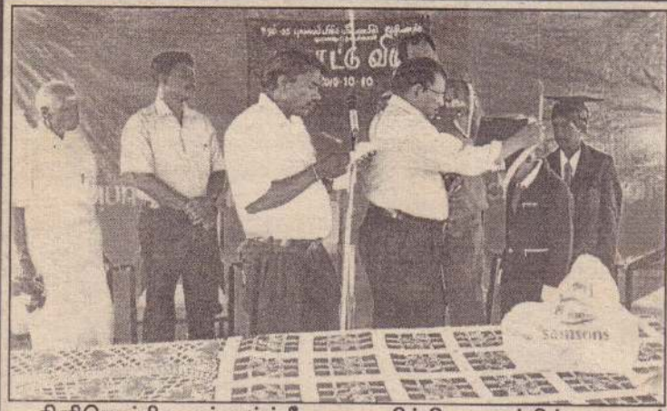
கிளிநொச்சி கறுக்காய்த்தீவு மகா வித்தியாலயத்தில் புலமைப் பரிசில் பரீட்சையில் சித்தியடைந்த மாணவர்களுக்கான கௌரவிப்பு விழா அண்மையில் இடம்பெற்றது. பாடசாலையின் பழைய மாணவர்களான பல்கலைக்கழக மாணவர்களால் ஏற்பாடு செய்யப்பட்ட இந்திகழ்வில் பேராசிரியர் பொ.பாலசுந்தரம்பிள்ளை சித்தியடைந்த மாணவர்களை கௌரவித்தபோது...

விசாரணைகளை மேற்கொண்ட மன்னார் மாவட்ட நீதிபதி குறித்த இரண்டு சிறுமிகளையும் வைத்திய பரிசோதனைக்கு உட்படுத்துமாறும் குறித்த சிறுவர் இல்லத்தில் உள்ள சிறுவர்களைப் பாதுகாப்பான இடங்களுக்கு மாற்றி குறித்த இல்லத்தினை மூடாமாறு உத்தரவிட்டிருந்தார். நேற்று முன்தினம் உத்தரவிட்டதைத் தொடர்ந்து அந்தச் சிறுவர் இல்லம் நேற்று மூடப்பட்டது. இதேவேளை குறித்த மத போதகர் தலைமறைவாகியுள்ள நிலையில் மன்னார் பொலிஸார் அவரை வலைவீசித் தேடிவருகின்றனர்.