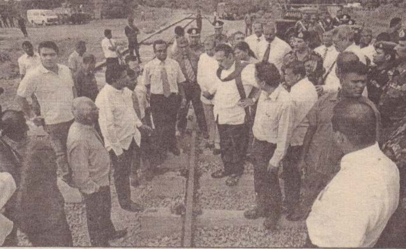
வடமாகாணத்தின் அபிவிருத்தி தொடர்பான மீளாய்வுக் கூட்டத்துக்காக வவுனியாவுக்குச் சென்ற ஜனாதிபதி மஹிந்த ராஜபக்ஷ வடக்குக்கான ரயில் பாதைப் புனரமைப்புப் பணிகளை ஒழுங்கமைக்கும் சென்று பார்வையிடும் காட்சி.

மாணவர்களின் பெற்றோர்களைக் கலந்து கொள்ளுமாறு பாடசாலையின் இயக்குநர், ஆசிரியர் ஆகியோர் அழைத்துள்ளனர். (த-121)