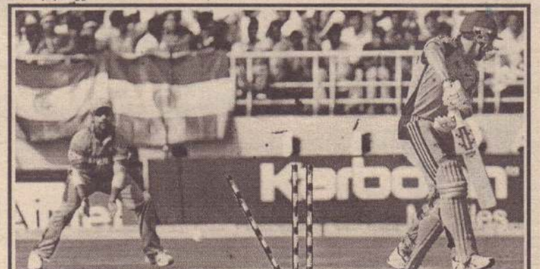
இந்திய-ஆஸ்திரேலிய அணிகளுக்கிடையில் விசாகப்பட்டினத்தில் நேற்று நடைபெற்ற ஒருநாள் கிரிக்கெட் போட்டியில், ஆஸ்திரேலிய அணியின் ஆரம்ப வீரரான ஜேன் மாஷலின் விக்கெட் நெஹ்ரா வீழ்த்தினார். ஜேன் மாஷல் ஆட்டமிழந்தபோது...

இதன் காரணமாக கொச்சி அணியும் ஐ.பி.எல்லிலிருந்து நீக்கப்படலாம் என்று எதிர் பார்க்கப்படுகிறது. இதனால் சென்னை, பெங்களூர், கல்கத்தா, மும்பை, டில்லி, டெக்கான் சார்ஜர்ஸ், புனே ஆகிய 7 அணிகள் மட்டுமே அடுத்த ஐ.பி.எல். போட்டியில்