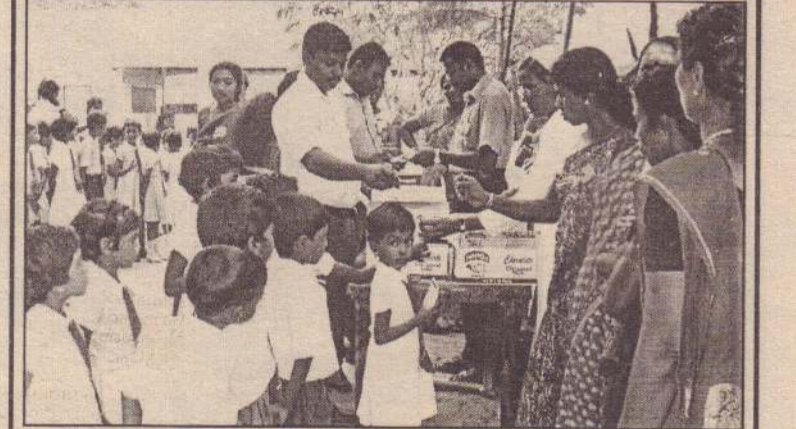
பருத்தித்துறை ஸ்ரீ இராமகிருஷ்ண சாரதா சேவாச்சிரமத்தினால் கிளிநொச்சி உருத்திரபாரம் புனித பற்றிமா நோமன் கத்தோலிக்க தமிழ்க் கல்வன் பாடசாலை மாணவர்களுக்கு பசுப்பால் வழங்கப்பட்டது. நிகழ்வில் பாடசாலை அதிபர் அருட்சகோதரி அன்றாறற்றா மற்றும் ஆசிரியர்கள் ஒன்றிணைந்து மாணவர்களுக்கு பசுப்பால் வழங்குவதைக் காணலாம். (படம்: காணன்)

பல போட்டிகளும் கலை நிகழ்வுகளும் இடம்பெறவுள்ளன. இடப்பெயர்வின் பின் மீள இயங்க ஆரம்பித்துள்ள இப்பாடசாலை குறுகிய காலத்திற்குள் தன்னை வளப்படுத்தி முல்லை மாவட்டத்தின் கல்வித் துறைக்கு அளப்பரிய சேவையை ஆற்றுகின்றது என்பது குறிப்பிடத்தக்கது. (6-121)