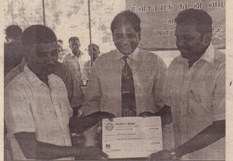
மக்கள் வாங்கி வாழைச்சேனை கிளைமூலம் சந்திவெளி விவசாயி ஒருவருக்கு பிரதியமைச்சர் விநாயகமூர்த்தி முரளிதரன் விவசாயக் கடன் வழங்குவதைப் படித்தல் காணலாம்.

மட்டக்களப்பு, ஒக்.21 மட்டக்களப்பு சந்திவெளி பிர தேசத்தில் வசிக்கும் விவசாயி களுக்கு வாழைச்சேனை மக்கள் வங்கியில் 32 லட்சம் ரூபா விவ சாயக் கடன் பெற்றுக் கொடுக்க பிரதியமைச்சர் விநாயகமூர்த்தி முரளிதரன் நடவடிக்கை மேற் கொண்டார்.