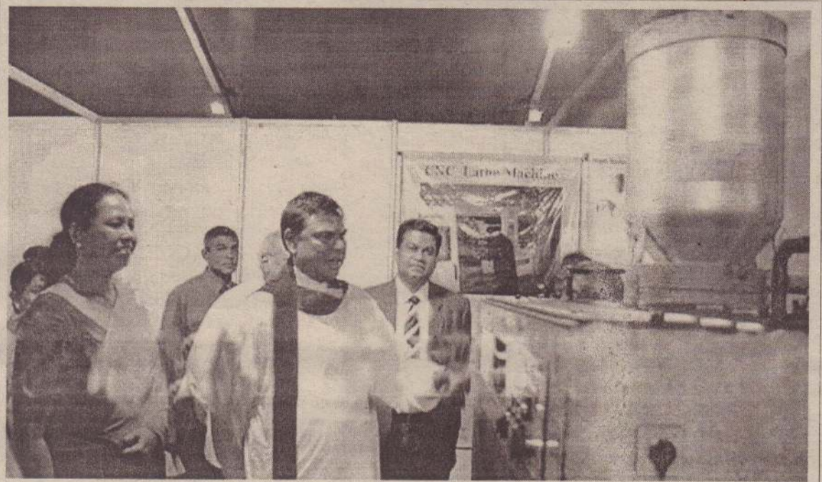
தொழில்நுட்ப மற்றும் ஆராய்ச்சி அமைச்சினால் ஏற்பாடு செய்யப்பட்ட டெக்னோலஜி மார்கெட்டிங் எனும் கண்காட்சி கொழும்பிலுள்ள பண்டாரநாயக்க நூபகார்த்த சர்வதேச மாநாட்டு மண்டபத்தில் நேற்றுமுன்தினம் நடைபெற்றது. இந்தக் கண்காட்சியை பொருளாதார அபிவிருத்தி அமைச்சர் பஸில் ராஜபக்ஷ பார்வையிடுகின்றார்.

இந்தப் பதவியை உருவாக்கும் முடிவை உடனடியாக எடுப்பதற்கு பிரிட்டன், கனடா, நியூசிலாந்து ஆகிய நாடுகள் வலியுறுத்தி வருகின்றன என்பது குறிப்பிடத்தக்கது. (ச-சி)