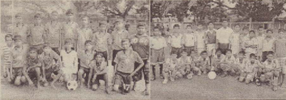
சென். ஜேம்ஸ் ஆண்கள் பாடசாலை முதலாமிடம் யாழ்.மத்திய கல்லூரி இரண்டாமிடம்

யாழ்ப்பாணம், ஒக்.26 யாழ். கல்விக்கோட்டப் பாடசாலைகளுக்கு இடையிலான 14 வயதுப் பிரிவு அணிகளின் உதைப்பந்தாட்டச் சுற்றுப் போட்டித் தொடரின் இறுதியாட்டத்தில் குருநகர் சென். ஜேம்ஸ் ஆண்கள் மகாவித்தியாலய அணி வெற்றி பெற்று யாழ். கோட்டமட்டச் சம்பியனாகியது. யாழ். மத்திய கல்லூரி மைதானத்தில் இடம்பெற்ற இறுதியாட்டத்தில் குருநகர்