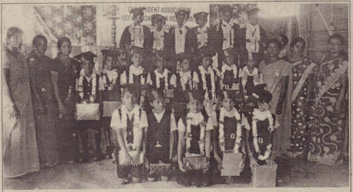
ஓட்டுசுட்டான் ஆறுமுகம் வித்தியாலயத்தில் தரம் 5 புலமைப்பரிசில் பரீட்சையில் சித்தியடைந்த மாணவர்களையும் 100 இற்கு மேல் புள்ளிகளைப் பெற்ற மாணவர்களையும் அவர்களை ஊக்குவித்த அதிபர், ஆசிரியர்களையும் வித்தியாலய பழைய மாணவர்கள் கௌரவித்தனர். கௌரவிக்கப்பட்ட மாணவர்கள் ஆசிரியர்களுடன் நிற்கின்றனர்.