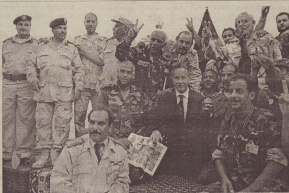
லிபியா, பென்காசியில் நடந்த பத்திரிகையாளர்கள் கூட்டத்தில் அந்நாட்டு இடைக்காலத் தலைவர் முஸ்தபா அப்தெல் ஜலில்(நடு) தேசிய இடைக்கால கவுன்சில் படையினருடன் காணப்படுகிறார்.

முன்னதாக, அல் இஸ்லாம் கைது செய்யப்பட்டதாக லிபிய புரட்சிப்படை அறிவித்திருந்தது. (ந)