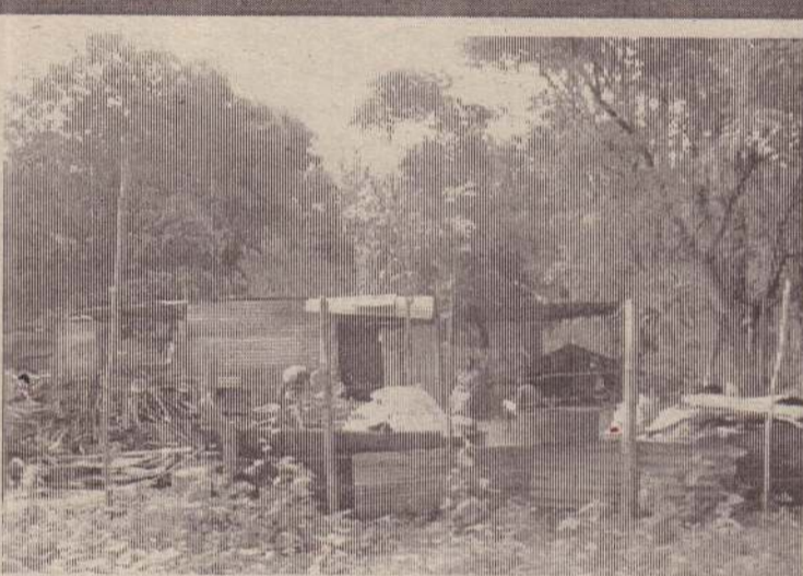
இதற்கு அடுத்தது என்ன: முல்லைத்தீவு மாவட்டம் புதுக்குடியிருப்பில் அமைக்கப்பட்டுள்ள இரும்பு விற்பனை நிலையமொன்று வியாபாரிகளின் வருகைக்காகக் காத்திருக்கின்றது. (433)