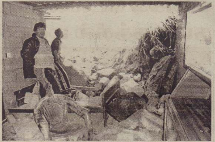
வெலிமடை, லந்தேகம பிரதேசத்தில் நேற்றுமுன்தினம் மண்சரிவு ஏற்பட்டுள்ளதனால் மக்களின் இயல்பு வாழ்க்கை பாதிப்படைந்துள்ளது.

தால் அள்ளண்டு போயுள்ளன. இது தவிர, பொறலந்த- கிரிந்த- தியத்தலாவை வீதிகளிலும், குருத்தலாவை- கல்லே தண்ட- தியத்தலாவை வீதி வரையிலான வீதிகளிலும் ஆங்காங்கே மண் சரிவு ஏற்பட்டு வீதியில் போக்குவரத்து செய்ய முடியாதுள்ளது. (ச)