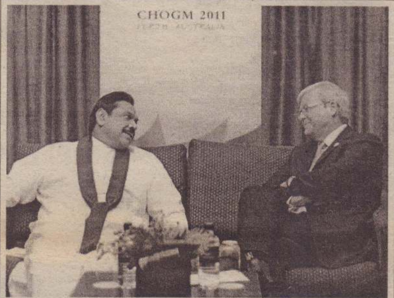
22 ஆவது பொதுநலவாய நாடுகளின் உச்சிமாநாட்டில் கலந்துகொள்ள ஆஸ்திரேலியா சென்றுள்ள ஜனாதிபதி மஹிந்த ராஜபக்ஷ அங்கு அந்நாட்டின் வெளிவிவகார அமைச்சர் கெவின் றூட்டைச் சந்தித்தபோது...

யாக இடம்பெறும் வர்த்தக மாநாட்டில் கருத்து வெளியிட்ட ஆஸ்திரேலிய பிரதமர் ஜூலியா கில்லார்ட் ஆஸ்திரேலியாவின் ஒத்த எண்ணப்பாடுகளைக் கொண்ட உலக நாடுகள் கூறுவதைப்போல, போர்க்குற்றங்கள் தொடர்பான விசாரணைகள் முழு அளவில் நடைபெறவேண்டும் என்பதை ஆஸ்திரேலியாவும் வலியுறுத்துவதாகச் சுட்டிக்காட்டினார். “தீவிரமான குற்றச்சாட்டுகள், மனித உரிமை மீறல்கள் இறுதி யுத்த காலகட்டத்தில் இடம்பெற்றதாகக் கூறப்படுவது விசாரிக்கப்பட வேண்டும்” - என்றார் ஆஸ்திரேலிய பிரதமர். முன்னதாக ஆஸ்திரேலியாவைப் போன்றே கனடாவும் இவ்வாறு வலியுறுத்தலொன்றை விடுத்திருந்தது. போர்க்குற்றங்கள் சம்பந்தமான நீதியான விசாரணை நடக்காத பட்சத்தில் 2013 ஆம் ஆண்டில் இலங்கையில் நடைபெறவுள்ளதாகக் கருதப்