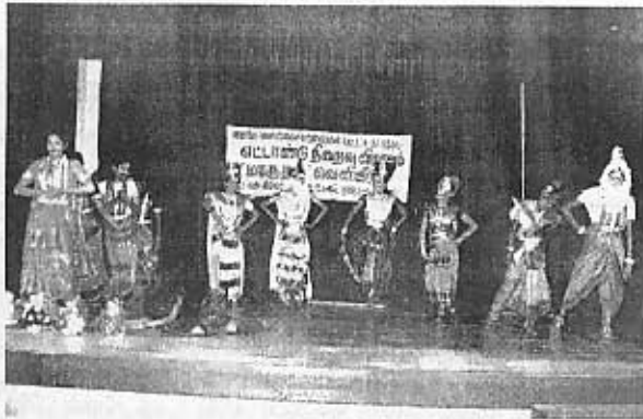
வவுனியா நிர்த்திய நிகேதன கலாமன்ற மாணவியரின் 'பாஞ்சாலி சபதம்'

வவுனியா நர்த்தனாஞ்சலி பள்ளியினரின் சிறுவர் நடனம்