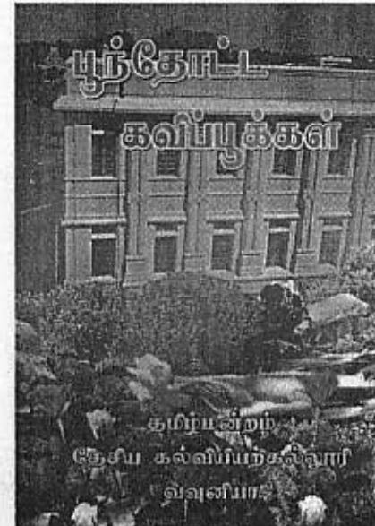
ஈழத்தில் வெளியான நூல்கள்

நன்றி : புதிய புத்தகம் பேசுது. ஜனவரி 2005/22. தமிழ்நாடு. இந்தியா.