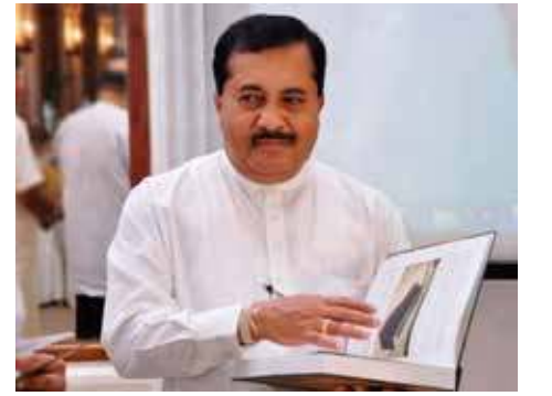
டத்தில் போட்டியிட்டு தோல்வியடைந்தார் என்பது குறிப்பிடத்தக்கது.

66 வயதான ரி.பி. எக்கநாயக்க ரணில் - மைத்திரி கூட்டு அரசாங்கத்தில், காணி இராஜாங்க அமைச்சராகப் பதவி வகித்திருந்தார். கடந்த ஓகஸ்ட் மாதம் நடந்த பொதுத் தேர்தலில் பொதுஜன பெரமுன சார்பில் குருநாகல் மாவட்ட