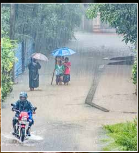
யாழ்ப்பாணம், டிசம்பர் 07

* புதன்கிழமை வரை மழை தொடரும் * பாடசாலைகளுக்கு இன்று விடுமுறை * 80 ஆயிரம் பேர் பாதிப்பு * 1,482 பேர் இடம்பெயர்வு