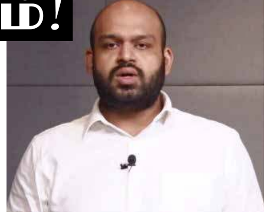
- சிலகால இராஜதந்திரி -

அ ரசியலில் சாணக்கியம் என்பது இராஜதந்திரத்தை குறிக்கின்றது. இந்தவகையில், மட்டக்களப்பு மாவட்ட தமிழ் தேசிய கூட்டமைப்பின் பாராளுமன்ற உறுப்பினர் இராசமாணிக்கம் சாணக்கியன் தனது மும்மொழி வாதத்திறமையோடு வடக்கு - கிழக்கில் தற்போது இடம்பெற்றுவருகின்ற அத்துமீறல்களை மிகத் தெளிவாக நேற்று முன்தினம் பாராளுமன்றில் குறிப்பிட்டிருந்தார்.