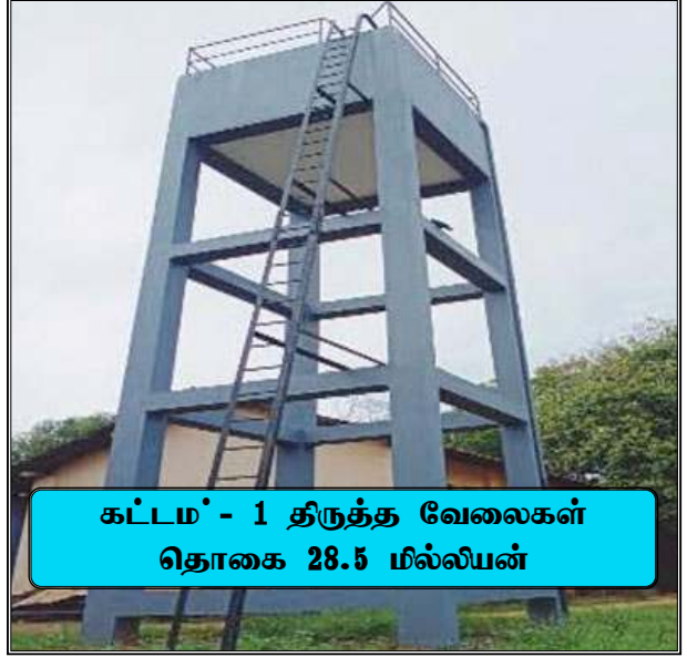
கட்டம் - 1 திருத்த வேலைகள் தொகை 28.5 மில்லியன்