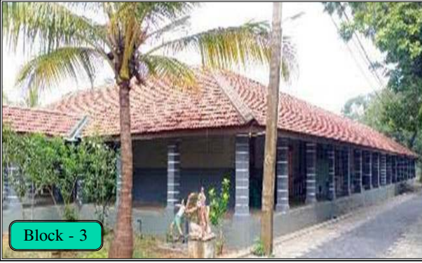
Block - 3